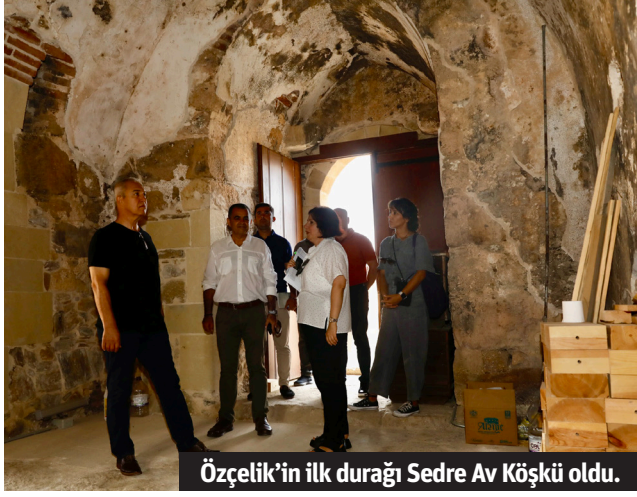
Özçelik'in ilk durağı Sedre Av Köşkü oldu.

kadar açmış ve turizme kazandırmış olacağız" dedi. HAYVAN BARINAĞINA ZİYARET Özçelik daha sonra Demirtaş Mahallesi'ndeki Alanya Belediyesi Sahipsiz Hayvan