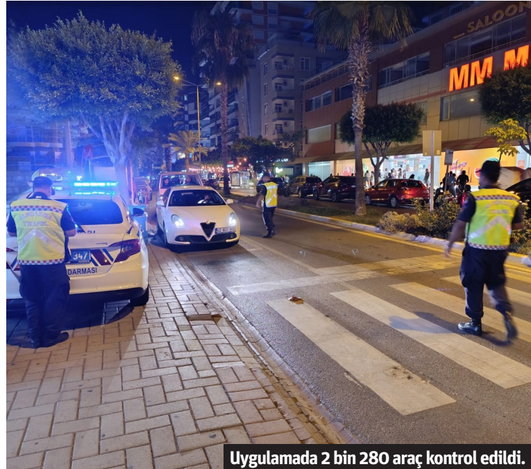
Uygulamada 2 bin 280 araç kontrol edildi.

ALANYA'DA jandarmanın yaptığı genel trafik uygulamasında gerekli şartları taşımayan 33 araç trafikten men edildi. Alanya İlçe Jandarma Komutanlığı tarafından genel trafik uygulamaları yapıldı.