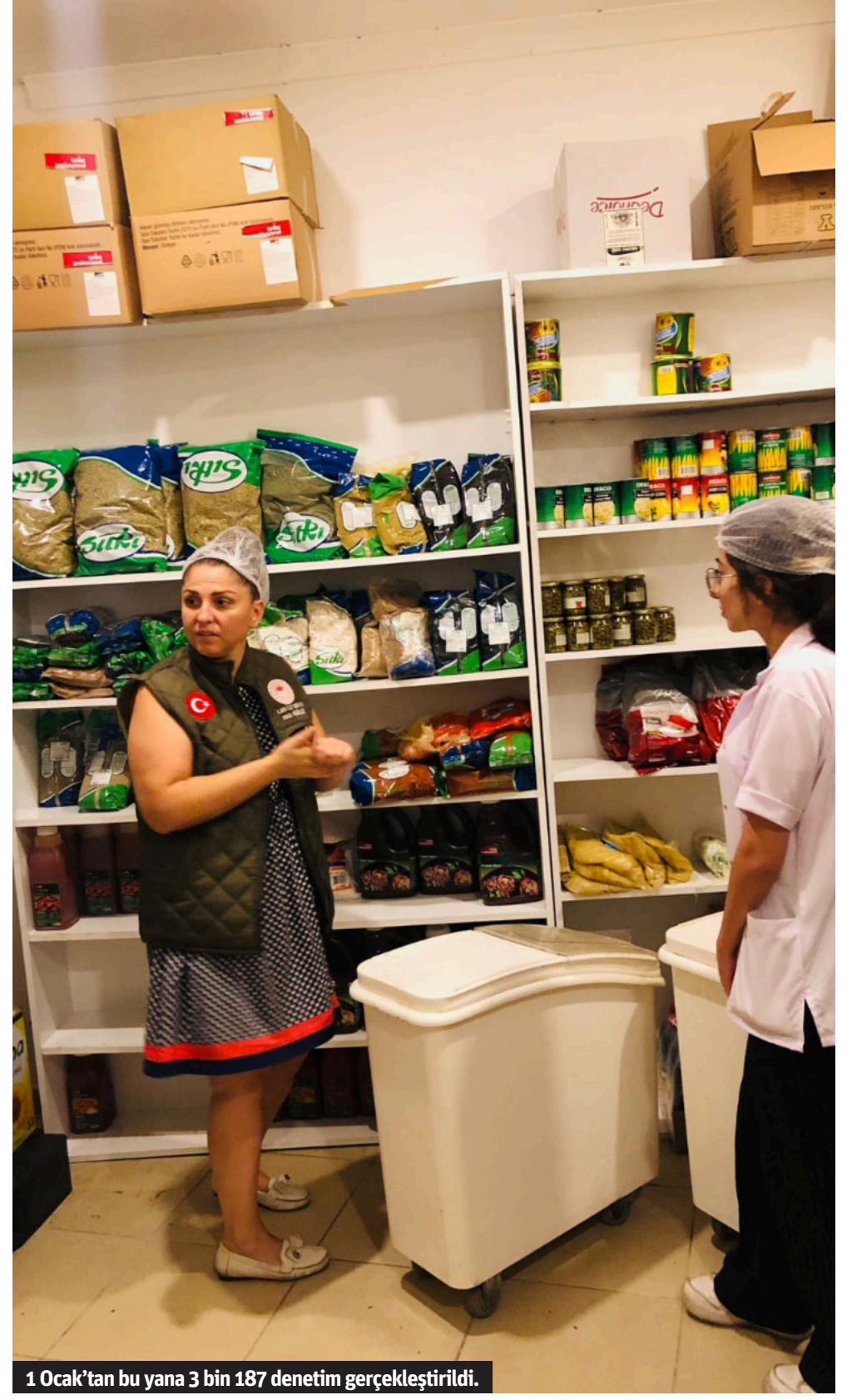
1 Ocak'tan bu yana 3 bin 187 denetim gerçekleştirildi.