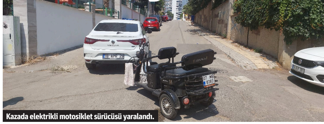
Kazada elektrikli motosiklet sürücüsü yaralandı.

Alanya'da otomobil ile elektrikli motosikletin çarpışması sonucu meydana gelen kazada 1 kişi yaralandı.