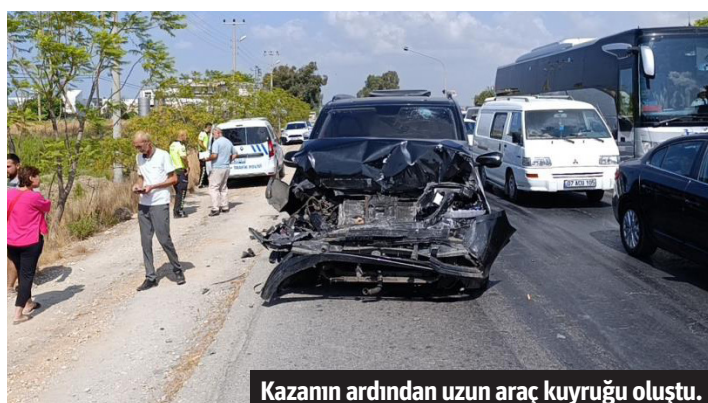
Kazanın ardından uzun araç kuyruğu oluştu.

oldukları tespit edilen M.A.D. ve K.İ.A. çaldıkları 760 metre kablo ile yakalandı. Jandarmadaki işlemlerinin ardından adliyeye sevk edilen şüpheliler tutuklanarak cezaevine gönderildi. - Mehmet AL