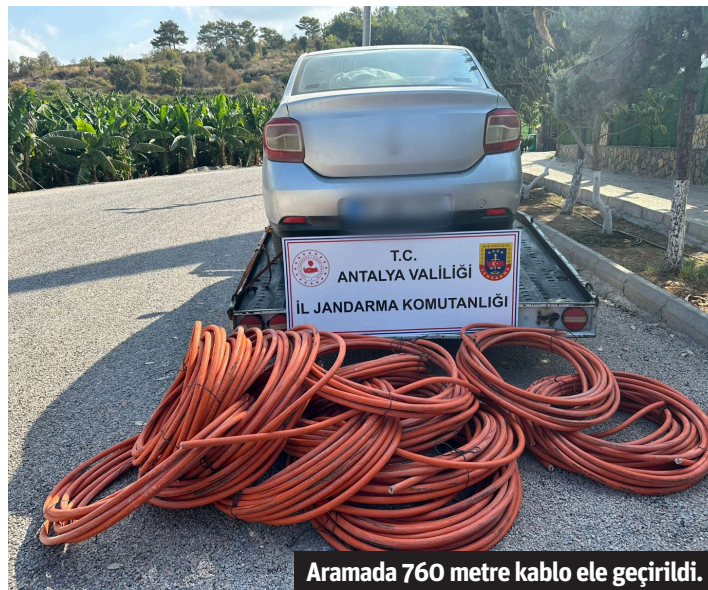
Aramada 760 metre kablo ele geçirildi.

SİLAHLI SALDIRIYA SERT TEPKİ Öte yandan, Antalyaspor Taraftarlar Derneği'ne yönelik gerçekleştirilen silahlı saldırı, derneğin sosyal medya hesaplarından yapılan açıklamayla kınandı. Yapılan açıklamada, "Bu korkakça eylemi gerçekleştirenlerin, kendilerini cesur sanan, aklı başında olmayan birkaç çoluk çocuktan ibaret olduğunu gayet iyi biliyoruz. Ellerine silah alarak güç zavalıhlar, ne yazık ki sadece acizliklerini gözler önüne sermişlerdir. Bu tür çirkin saldırılar, Antalyaspor taraftarlarının birliğini bozmaya yetmez. Aksine bizi daha da güçlendirecek, daha da kenetleyecektir" denildi. - İHA