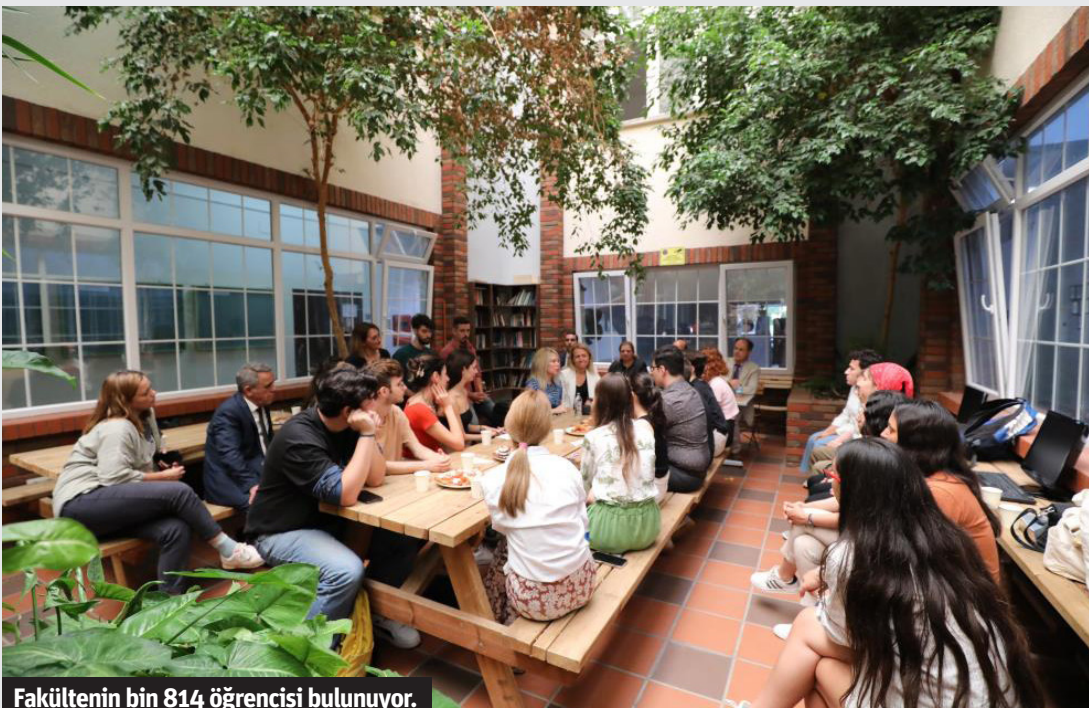
Fakültenin bin 814 öğrencisi bulunuyor.

Eğitim-öğretim süreçleri içinde öğrencilerin teorik bilgilerini pekiştirebilmelerine yardımcı olacak Kültür ve Turizm, Gastronomi ve Animasyon Öğrenci Toplulukları öğrencilere hem sosyalleşme hem de mesleki becerilerini geliştirme imkanı sunuyor. Mezunlar, otelcilik, seyahat acenteciliği, havayolu şirketleri gibi çeşitli turizm sektörlerinde yöneticilik ve uzmanlık pozisyonlarında görev alıyor. Ayrıca, lisansüstü düzeyde yüksek lisans ve doktora programları da sunulmakta olup, bu programlar yüzde 100 Türkçe ve İngilizce olarak iki ayrı dilde eğitim imkanı sağlıyor. ALMANYA'DA İŞ YERİ EĞİTİMİ İMKANI Fakülte, uluslararasılaşma yönündeki çabalarını sürdürüyor. Almanya ile yapılan ZİHOĞA sözleşmesi sayesinde, öğrenciler her yıl sınırsız kontenjanla Almanya'da iş yeri eğitimi alabiliyor. Ayrıca, Erasmus Programı, Mevlana Değişim Programı ve Freemover aracılığıyla öğrenciler, AB ülkeleri ve dünya genelinde çeşitli öğrenim fırsatlarından yararlanabiliyor. Akdeniz Üniversitesi Turizm Fakültesi, dünya çapında bir liderlik vizyonu ile hareket ederek hem ulusal hem de uluslararası alanda turizm eğitiminin kalitesini artırmaya devam ediyor. – İHA