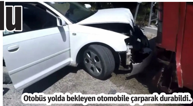
Otobüs yolda bekleyen otomobile çarparak durabildi.

şık 20 turistin bulunduğu tur otobüsünde şoförün yerinden kalkarak su şakasına katılması sonucu meydana gelen kaza ile ilgili İlçe Jandarma Komutanlığı adli işlem başlattı. Sapadere Mahallesi'nde meydana gelen olayla ilgili olarak 07 BBR 883 plakalı Suvari Safari firmasına ait otobüsün trafik güvenliğini tehlikeye