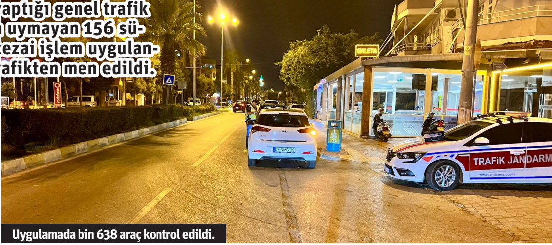
Uygulamada bin 638 araç kontrol edildi.

ALANYA İlçe Jandarma Komutanlığı tarafından genel trafik uygulamaları yapıldı. Yapılan uygulamalarda bin 638 araç kontrol edildi. 156 araca 400 bin 647 TL cezai işlem uygulanan denetimde 6 araç trafikten men edildi. - Alanya Kaymakamlığı / Bülten