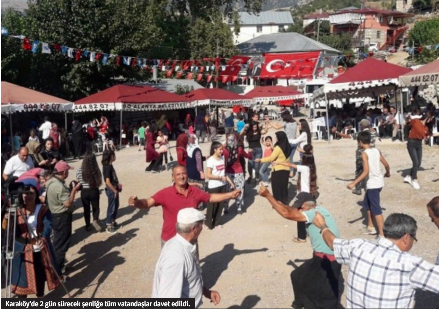
Karaköy'de 2 gün sürecek şenliğe tüm vatandaşlar davet edildi.