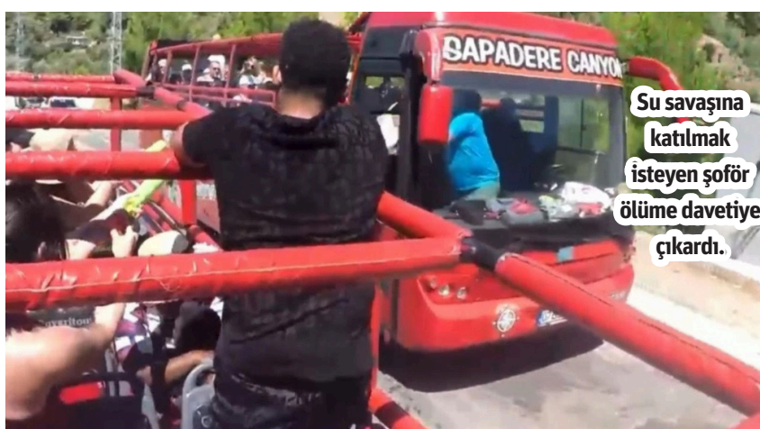
Su savaşına katılmak isteyen şoför ölümüne davetiye çıkardı.

sokacak şekilde trafikte seyir halinde olduğu görüntülerin haber sitelerinde yayınlanmasının ardından yetkililer harekete geçti. FİRMA VE SÜRÜCÜNÜN DUYARSIZLIĞI TEPKİ ÇEKTİ Uçuruma yuvarlanmaktan sonra kurtulan otobüs şoförü A.Y. hakkında adli işlem başlatıldı. Ulusal ve yerel basında yer alan haberlerin ardından vatandaşlar da durum tepki gösterdi. Şoförün sorumsuzluğu ve su şakasına tepki gösteren vatandaşlar safari kazalarının bir an önce önüne geçilmesine istedi. - Mehmet AL