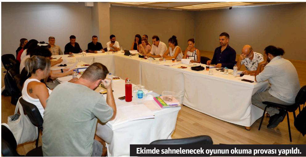
Ekimde sahnelenecek oyunun okuma provası yapıldı.

sosyolog danışmanlığını ise Ebru Melis Tumbul yapacak. Oyun, Shakespeare'nin Othello oyununun prömiyerinin ardından yapılan partide yaşanan gizemli bir ölümlü konu alıyor ve mizah dolu bir polisiye