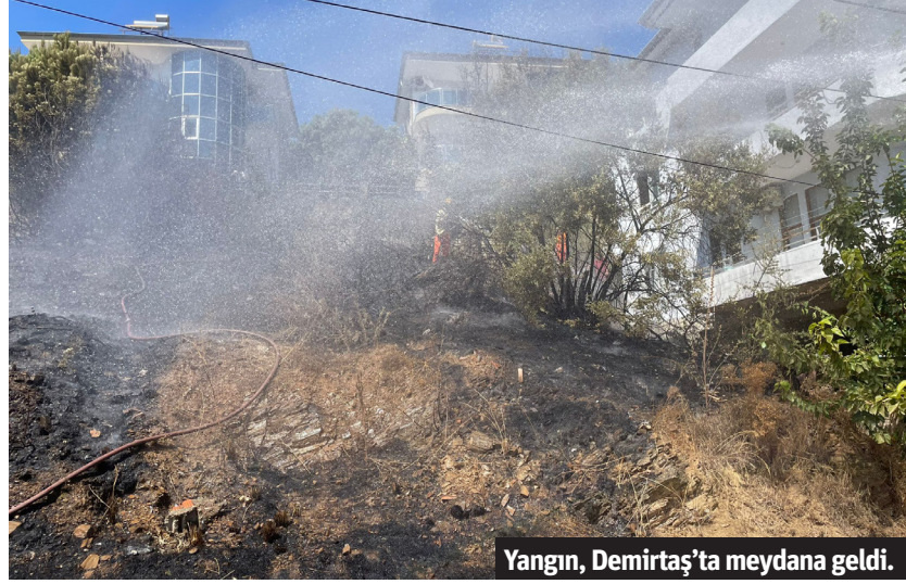
Yangın, Demirtaş'ta meydana geldi.

ALANYA'DA bir bahçede meydana gelen yangında 5 ağaç yandı. Olay, Demirtaş Mahallesi, Öğretmenler Sokak'ta meydana geldi. A.K.'ye ait arsa içerisinde elektrik direğinden dolayı çıktığı düşünülen yangın meydana geldi. Yangını gören çevredekiler