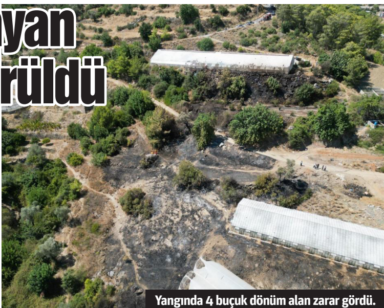
Yangında 4 buçuk dönüm alan zarar gördü.

GAZİPAŞA'DA yerleşim yerine yakın noktada çıkan yangın kısa sürede büyüyerek ormanlık alana sıçradı. Ekiplerin zamanında müdahalesiyle kontrol altına alınan yangında, seralar ve ormanlık alan zarar gördü. Yangın, saat 13.30 sıralarında Karalar Mahallesi, Hüseyinli Mevkii'nde meydana geldi. Çıkış nedeni henüz belirlenemeyen yangını fark eden mahalle sakinleri, durumu 112 Acil Çağrı Merkezine bildirdi. Alınan ihbarın ardından olay yerine jandarma, Gazipaşa Orman İşletme Müdürlüğü ve Antalya Büyükşehir Belediyesi Gazipaşa İtfaiye Birimi ekipleri sevk edildi. Yangına, 30 personel, 2 ilk müdahale aracı, 3 arazöz, 3 tankerle müdahale eden ekipler, yangını kısa sürede kontrol altına