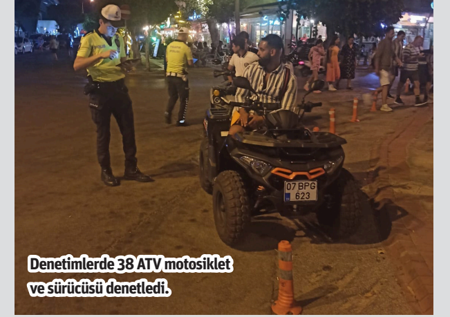
Denetimlerde 38 ATV motosiklet ve sürücüsü denetledi.

ALANYA İlçe Emniyet Müdürlüğü tarafından ATV motosikletlere yönelik trafik denetimleri gerçekleştirildi. Yapılan denetimlerde 38 ATV motosiklet ve sürücüsü denetlendi. Denetimde 7 ATV motosiklet sürücüsüne toplamda 30 bin 572 TL cezai işlem uygulanırken, 2 ATV motosiklet trafikten men edildi. – Alanya Kaymakamlığı / Bülten