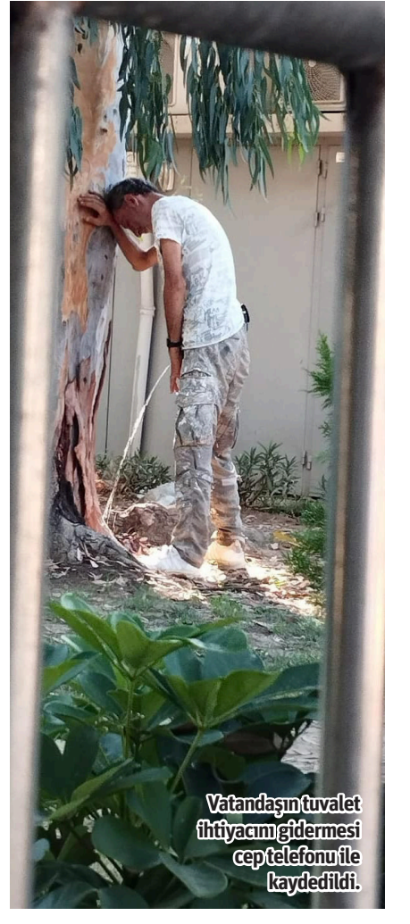
Vatandaşın tuvalet ihtiyacını gidermesi cep telefonu ile kaydedildi.

ALANYA'DA gündüz vakti tuvaletini yapan bir kişi vatandaşların tepkisini çekti. Olay, Mahmutlar Belediye Hizmet binası yanında bulunan ATM'lerin arkasında gerçekleşti. Bir vatandaşın cep telefonu kamerası ile kaydettiği görüntülerde, bir kişinin gündüz vakti tuvaletini yaptığı görüldü. Konuyla ilgili sosyal medya üzerinden sitem eden vatandaşlar, "Mahmutlar Belediye hizmet binası yanında bulunan ATM'lerin hemen arkasına bir şahıs tuvaletini yaparken kaydedildi. Burası şehrin tam ortası, güpegündüz gündüz üstelik tam karşısında umumi WC'ler bulunuyor. Bu nedir kardeşim, üstelik burası kültür ve çocuk parkı" ifadelerini kullandı. - Gülşah Ataoğlu