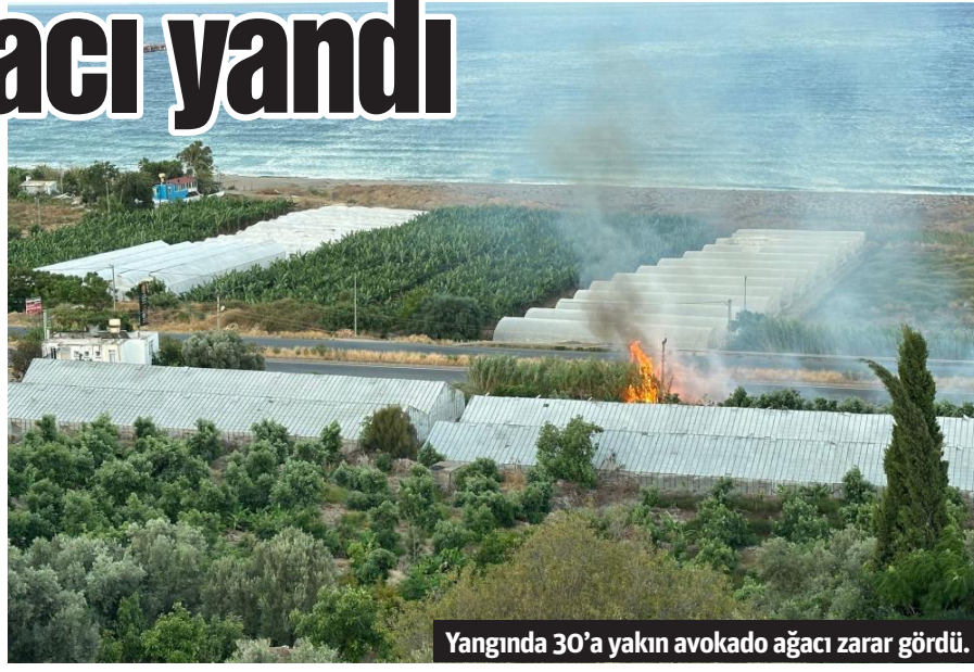
Yangında 30'a yakın avokado ağacı zarar gördü.

geniş bir alana yayıldı. Mahalle sakinleri bir taraftan kendi imkanlarıyla yangına müdahale ederken, diğer taraftan yangını 112 Acil Çağrı Merkezi'ne bildirdi. İhbarla bölgeye sevk edilen Antalya Büyükşehir Belediyesi itfaiye ekipleri yangını kısa sürede söndürdü. Yangında ölen ya da yaralanan olmazken, 30'a yakın avokado ağacı ise zarar gördü. – İHA