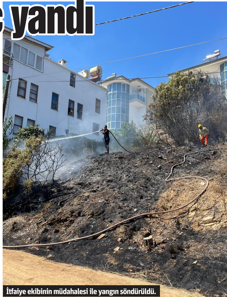
İtfaiye ekibinin müdahalesi ile yangın söndürüldü.

durumu 112 Acil Çağrı Merkezi'ne bildirdi. İhbar üzerine bölgeye jandarma ve itfaiye sevk edildi. İtfaiye ekiplerinin müdahalesi sonucunda yangın kısa sürede söndürülürken, yangında 5 ağaçta zarar meydana geldi. Jandarma yangınla ilgili inceleme başlattı. – Mehmet AL