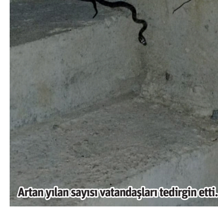
Artan yılan sayısı vatandaşları tedirgin etti.

SICAK havanın etkisini arttırmasıyla birlikte Alanya'nın farklı mahallelerinde bulunan bahçelerde sayıları her geçen gün artan yılanlar vatandaşları alarma geçirdi. Alanya'da yaz aylarının gelmesiyle birlikte sürün-