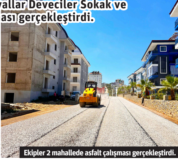
Ekipler 2 mahallede asfalt çalışması gerçekleştirdi.

Mahallesi, Köşeler Caddesi'nde asfalt sathi kaplama çalışması yapıldı. Alanya Belediyesi envanterine yeni kazandırılan ve hem maddi hem de zamandan tasarruf sağlayan kombi sathi kaplama araçları ile gerçekleştirilen çalışmalar aynı gün içerisinde tamamlanırken, yollar vatandaşların kullanımına açıldı. Asfalt çalışmaları planlama dahilinde ihtiyaç olan bölgelerde devam edecek. - Alanya Belediyesi / Bülten