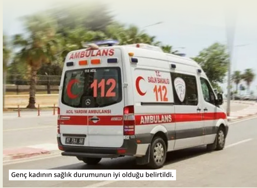
Genç kadının sağlık durumunun iyi olduğu belirtildi.