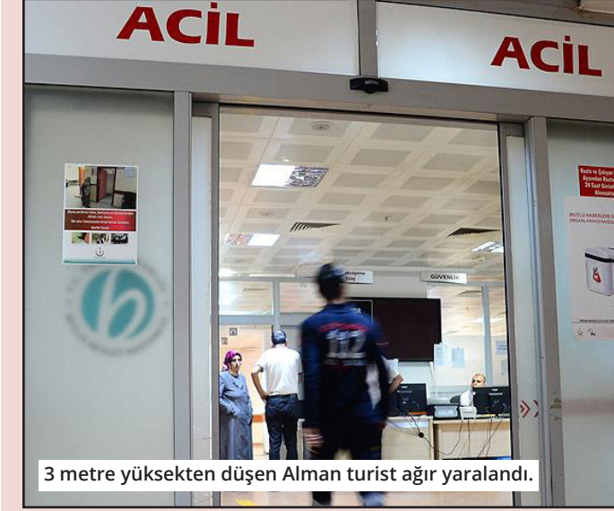
3 metre yüksekten düşen Alman turist ağır yaralandı.

Alanya'da tatil yaptığı otelde 3 metre yüksekten düşen Alman turist ağır yaralandı. Olay Türkler Mahallesi'nde meydana geldi. Otelde tatil yapan Alman uyruklu P.M.H. bir anlık dikkatsizlik sonucu 3 metre yükseklikten düştü. Olayı gören çevredekiler durumu 112