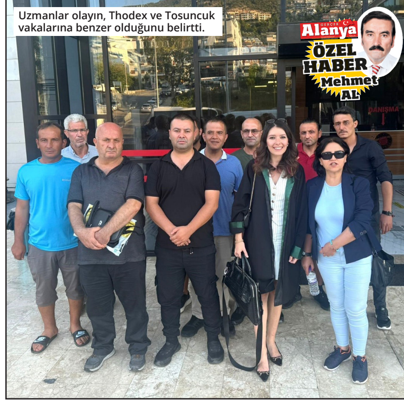
Uzmanlar olayın, Thodex ve Tosuncuk vakalarına benzer olduğunu belirtti.

Alanya 1. Ağır Ceza Mahkemesinde kendilerini dolandıran Şirket yöneticilere ateş püsküren bazı mağdurlar kendilerini savunan avukatla birlikte Adliye önünde fotoğraf çektirdiler. ● MEHMET AL