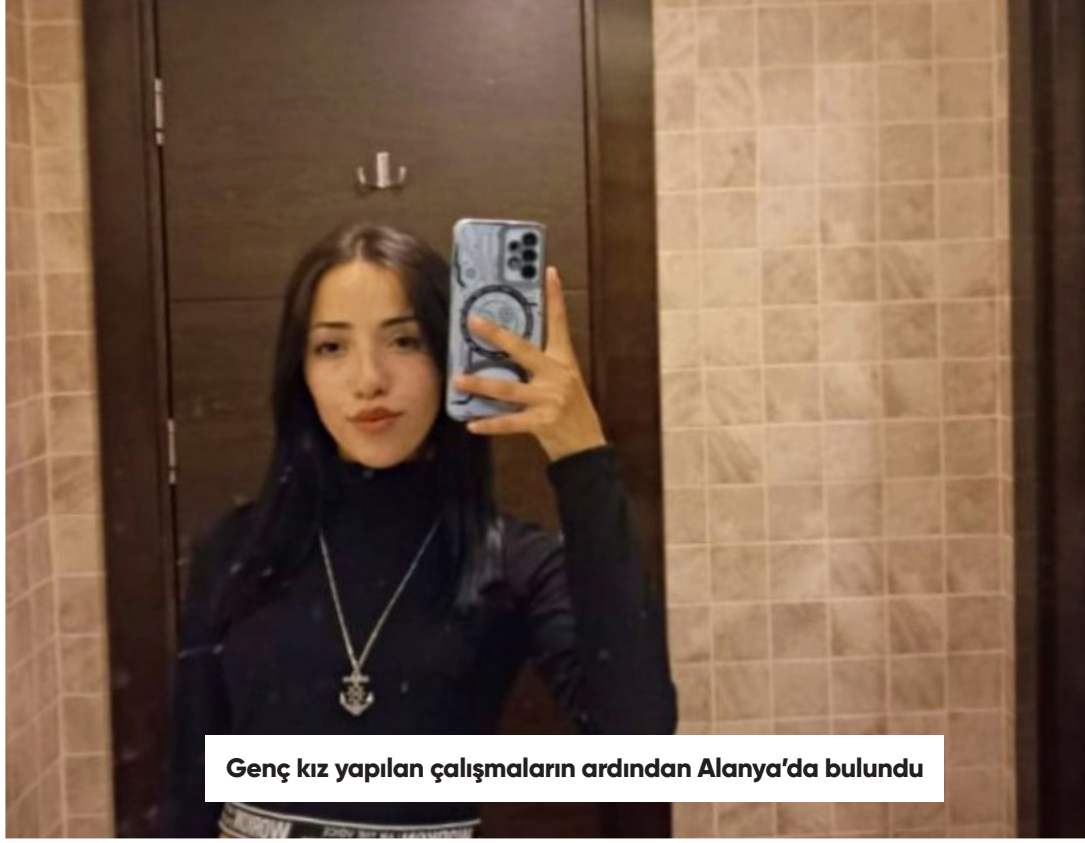
Genç kız yapılan çalışmaların ardından Alanya'da bulundu