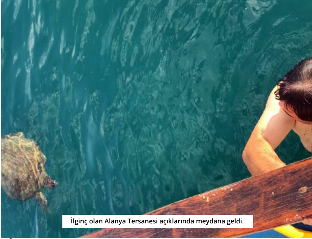
İlginc olan Alanya Tersanesi açıklarında meydana geldi.

Alanya'da, tarihi tersane önünde sabah saatlerinde dalış yapmak isteyen iki arkadaş, yaklaşık 80 santimetre boyunda carretta caretta ile karşılaştı. İlk başta korkan ikili, daha sonra yaklaşık 1,5 saat boyunca kaplumbağa ile birlikte yüzdü.