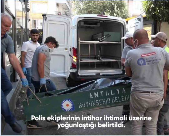
Polis ekiplerinin intihar ihtimali üzerine yoğunlaştığı belirtildi.

Antalya'da internet üzerinden oynadığı kumar nedeniyle çevresine borçlu olduğu iddia edilen aşçı, çalıştığı iş yerinin mutfağında ölü olarak bulundu. Polis intihar ihtimali üzerinde dururken, aşçının cansız bedeni cenaze aracına konurken mesai arkadaşları gözyaşı döktü.