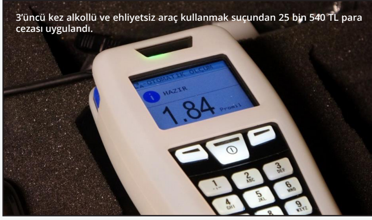
3'üncü kez alkollü ve ehliyetsiz araç kullanmak suçundan 25 bin 540 TL para cezası uygulandı.