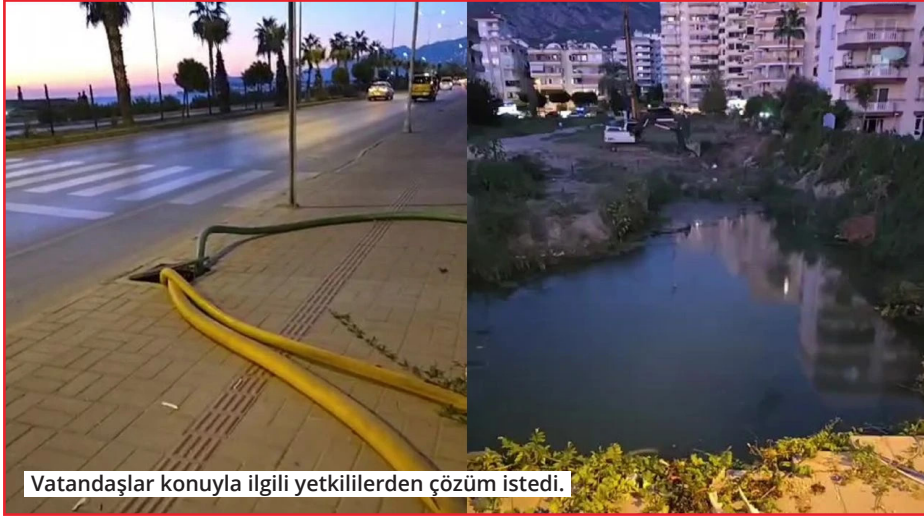
Vatandaşlar konuyla ilgili yetkililerden çözüm istedi.

Alanya'nın gözde bölgelerinden Mahmutlar'da yaşayan vatandaşlar, mide bulandıran bir iddiayla mücadele ediyor. Cebeci-6 Sitesi bitişiğindeki bir inşaatın pompalarla doğrudan denize akıtıldığı öne sürülen pis sular, bölge halkını endişelendiriyor. Görüntülerde, kirli suların denize karıştığı anlar ve hemen yanı başında denize giren insanlar dikkat çekti. Vatandaşlar, "Defalarca şikayet ettik, ama sonuç alamadık. Denizimiz kirleniyor, sağlığımız tehlikede!" diyerek yetkililerden acil çözüm talep etti. İddialara göre, inşaatın gelen kirli sular, doğrudan denize akıtılıyor ve bölgedeki kirlilik nedeniyle halkın denize girmesi imkansız hale gelmiş durumda. Vatandaşlar, çevre ve sağlık açısından ciddi tehdit oluşturan bu duruma karşı yetkililerden hemen harekete geçmesini istiyor. ● HAYAL BAŞAR