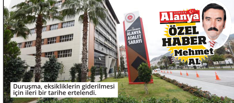
Duruşma, eksiklerin giderilmesi için ileri bir tarihe ertelendi.