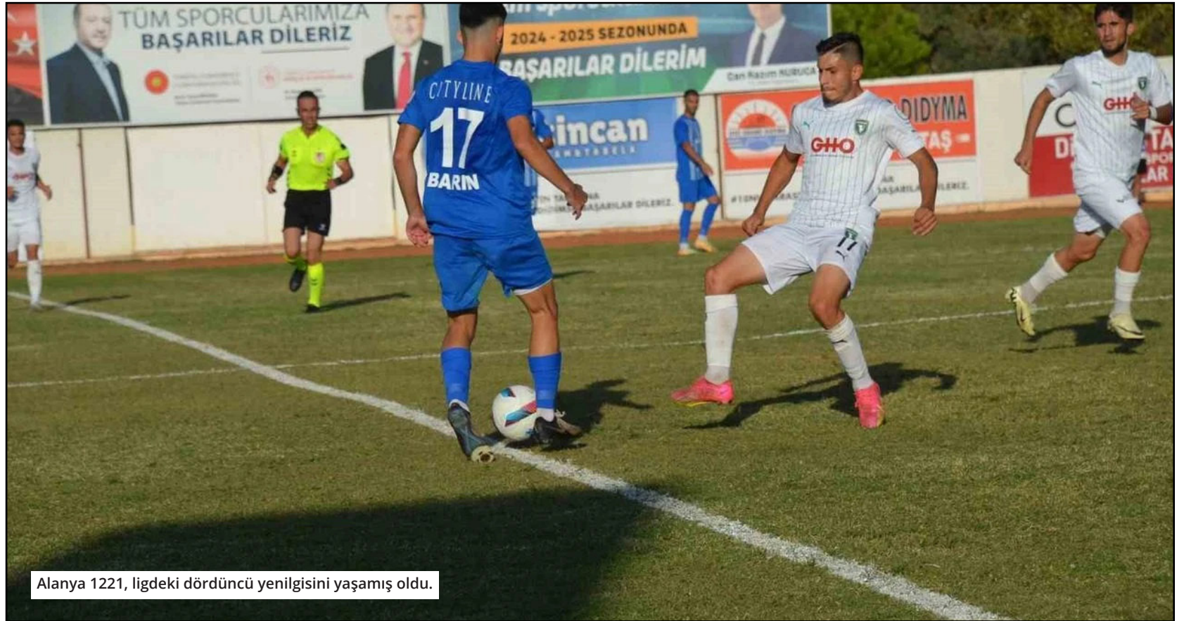
Alanya 1221, ligdeki dördüncü yenilgisini yaşamış oldu.