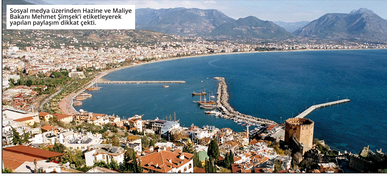
Sosyal medya üzerinden Hazine ve Maliye Bakanı Mehmet Şimşek'i etiketleyerek yapılan paylaşım dikkat çekti.

Alanya'da inşa edilen lüks sitelerde yabancılara kiralanılan dairelerin kirasının elden tahsil edilerek vergi kaçırıldığı iddiası sosyal medyada yankı uyandırdı. Bir kullanıcı, Hazine ve Maliye Bakanı Mehmet Şimşek'i etiketleyerek bu durumu bakanın dikkatine sundu. İddiaya göre Alanya'daki birçok lüks sitede yabancılara kiralanan dairelerin kirası nakit olarak tahsil ediliyor. Bu durumun vergi kaybına yol açtığı öne sürülüyor. Aylık 1500-2000 Euro civarında olan kira bedellerinin tamamının elden alındığı belirtiliyor. Sosyal medya kullanıcısı, yaptığı paylaşımda bu durumun vergi kaçırılmasına neden olduğunu iddia ederek yetkililerden konuyla ilgili inceleme başlatılmasını talep etti.