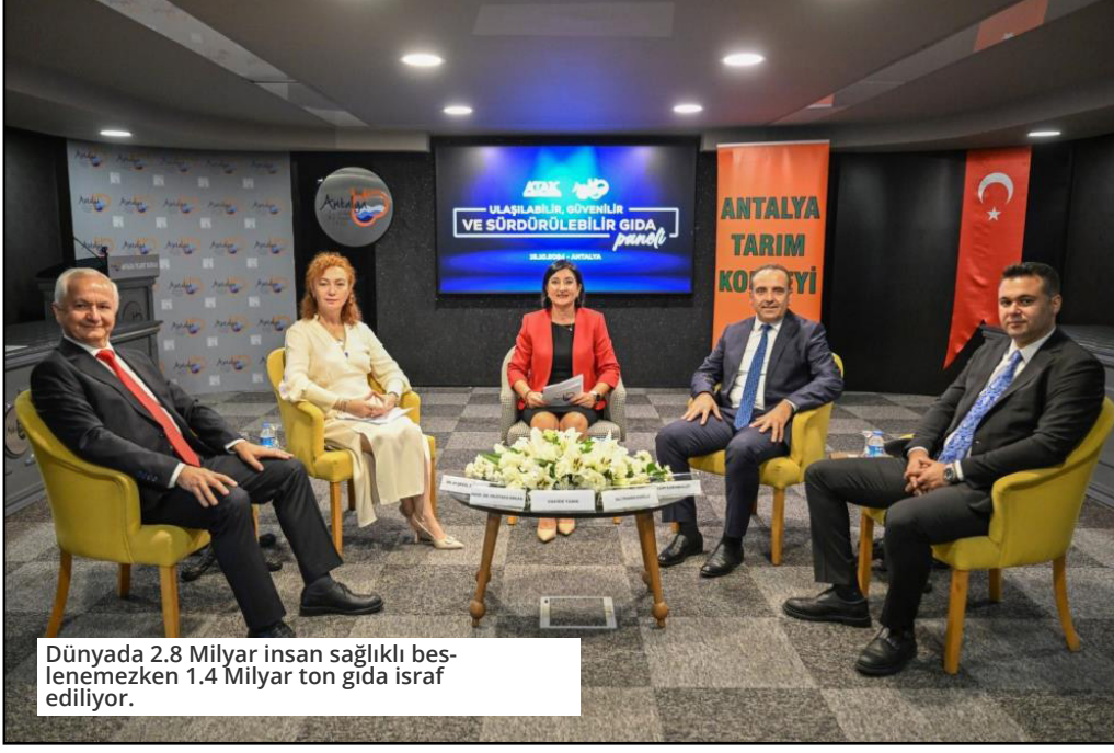
Dünyada 2.8 Milyar insan sağlıklı beslenemeyen 1.4 Milyar ton gıda israf ediliyor.