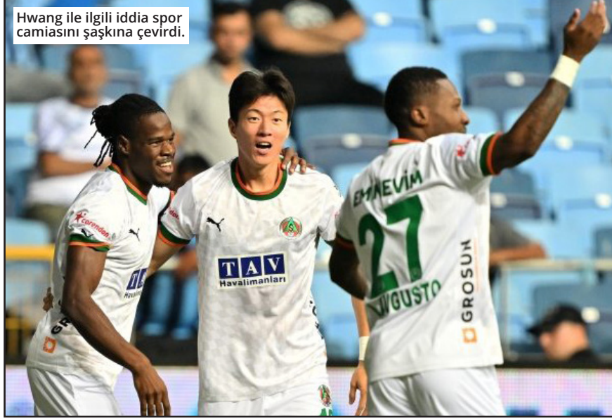
Hwang ile ilgili iddia spor camiasını şaşkına çevirdi.

Hwang, baldızına yönelik şikayetlerde bulunmuş olsa da, polis soruşturmasını videoların izinsiz ve yasadışı şekilde çekildiğini ortaya koydu. Olayın geniş yankı uyandırmasının ardından futbol-