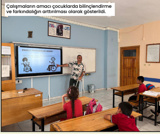
Çalışmaların amacı çocuklarda bilinçlendirme ve farkındalığın artırılması olarak gösterildi.

Alanya Belediyesi Engelsiz Park ve Yaşam Merkezi uzmanları, okullarda düzenledikleri etkinliklerle güvenli internet kullanımı, engelli farkındalığı seminerleri ve önlümcü sağlık taraması gibi faaliyetlerle çocukların hem sosyal becerilerini geliştirmeyi hem de sağlıklarıyla ilgili bilinçlenmelerini hedefliyor. Engelsiz Park ve Yaşam Merkezi Psikoloğu tarafından üçüncü sınıf öğrencilerine yönelik düzenlenen engelli farkındalığı seminerinde bir sunum gerçekleştirilerek, çocukların empati kurabilmesi için çeşitli farkındalık uygulamaları yapıldı.