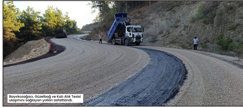
Bayırkozağacı, Güzelbağ ve Katı Atık Tesisi ulaşımını sağlayan yolları asfaltlandı.

Büyükşehir Belediyesi Kırsal Hizmetler Dairesi Başkanlığı Alanya ekipleri, ilçenin kırsal mahalle grup yollarında da bakım onarım çalışmalarına aralıklı devam ediyor. Büyükşehir ekipleri, Keşefli, Kayabaşı, Türkteaş, Yeniköy ve Hacıkerimler mahallesi grup yollarında bakım onarım çalışması gerçekleştirdi. Akçatı Mahallesi grup yolunda ise heyelan olan bölgede tedbir amaçlı şarapöl açma ve taş duvar çalışması yapılıyor. ● ERKAN UYSAL