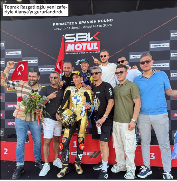
Toprak Razgatlıoğlu yeni zafereyle Alanya'yı gururlandırdı.

2024 Dünya Superbike Şampiyonası'nın (WSBK) 12. ve son ayağının ilk yarışı, İspanya'nın 4 bin 423 kilometre uzunluğa sahip Circuito de Jerez Pisti'nde gerçekleşti. Milli motosikletçi Toprak Razgatlıoğlu'nun şampiyon olduğu yarış Alanya'dan ilgi ve coşkuyla takip edildi. Yediden yetmişe herkes sosyal