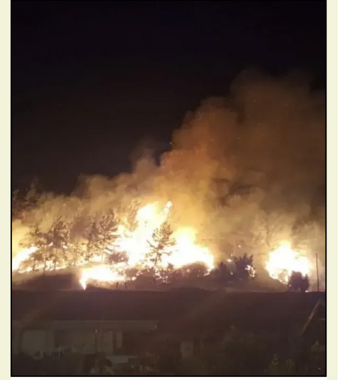
Yangına, 8 arazöz, 5 itfaiye aracı, su ikmal aracı müdahale etti.

Alanya'nın Dim Vadisi üzerinde bulunan ormanlık alanda çıkan yangın kısa sürede kontrol altına alındı. Dim Vadisi'ndeki Kuzyaka Mahallesi'nde yerleşim yerlerine yakın ormanlık alanda henüz belirlenemeyen nedenle yangın çıktı. Rüzgarın etkisiyle büyüyen yangına, ihbar üzerine, 8 arazöz, 5 itfaiye aracı, su ikmal aracı, ilk müdahale aracı ve çok sayıda yer ekibiyle müdahale edildi. Yaklaşık 3 hektarlık alanda etkili olan yangın, kısa sürede kontrol altına alındı. ● MEHMET AL