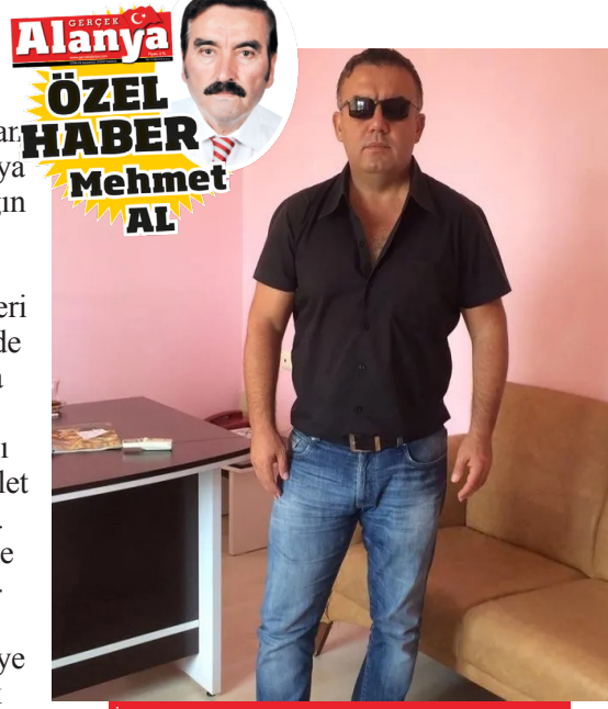
İlk duruşma sabah 09.30'da başlayıp 18.00'de sona erdi.