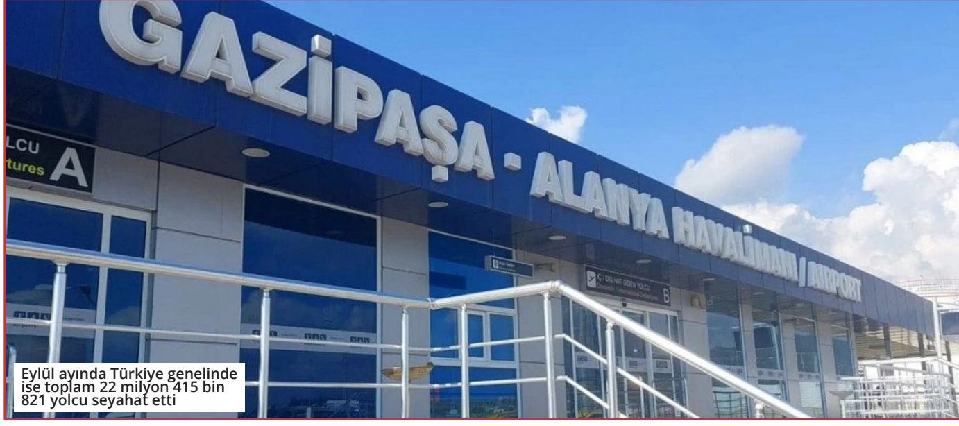
Eylül ayında Türkiye genelinde ise toplam 22 milyon 415 bin 821 yolcu seyahat etti

Ulaştırma ve Altyapı Bakanı Abdulkadir Uraloğlu, eylül ayında Gazipaşa Alanya Havalimanı'na 838 bin yolcunun geldiğini açıkladı. Eylül ayında Türkiye genelinde ise toplam 22 milyon 415 bin 821 yolcu seyahat etti. Uraloğlu, iç hat yolcu sayısının 373 bin 778, dış hat yolcu sayısının ise 464 bin 609 olduğunu belirtti. 2024 yılının ilk 9 ayında Türkiye genelinde 177 milyon yolcuya hizmet verildi. İstanbul Havalimanı, bu dönemde 60 milyon 659 bin yolcu ağırlarken, Sabiha Gökçen Havalimanı'nda ise 30 milyon 971 bin yolcu hizmet aldı. Uraloğlu, havalimanlarındaki uçak trafiğinin de önemli bir artış gösterdiğini vurguladı. ● GÜLŞAH ATAÖĞÜ