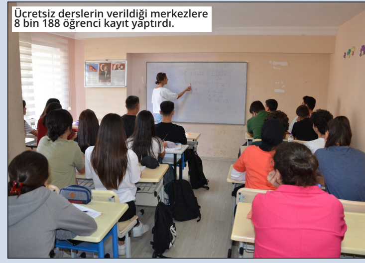
Ücretsiz derslerin verildiği merkezlerde 8 bin 188 öğrenci kayıt yaptırdı.

Öte yandan ATABEM Alanya Birimi kurulduğu 2022'den bu yana kadro, öğrenci ve kurs sayısı bakımından büyük gelişim kaydetti. Vatandaşların yoğun talebi üzerine sürekli öğrenci sayısı artan Alanya ATABEM'de bu yıl 3 bin 331 öğrenci eğitim görüyor. Üniversiteye hazırlık mezunlar grubunda 491, ortaokul grubunda ise 2 bin 840 olmak üzere toplam 3331 öğrenciye, haftanın altını günü kurs ve ders veriliyor. 30 Eylül 2024'te başlayan kurslar 31 Mayıs 2025'te sona erecek. ● BŞB/BÜLTEN