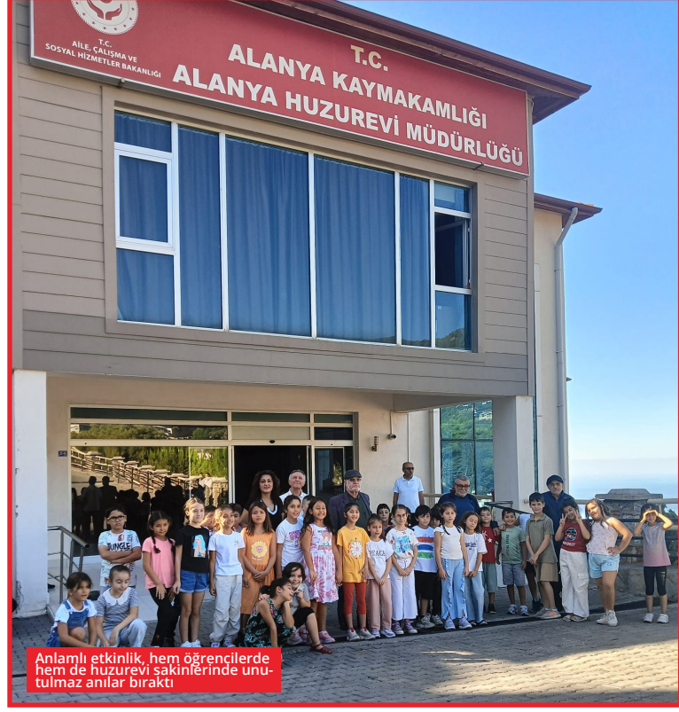
Anlamlı etkinlik, hem öğrencilerde hem de huzurevi sakinlerinde unutulmaz anılar bıraktı