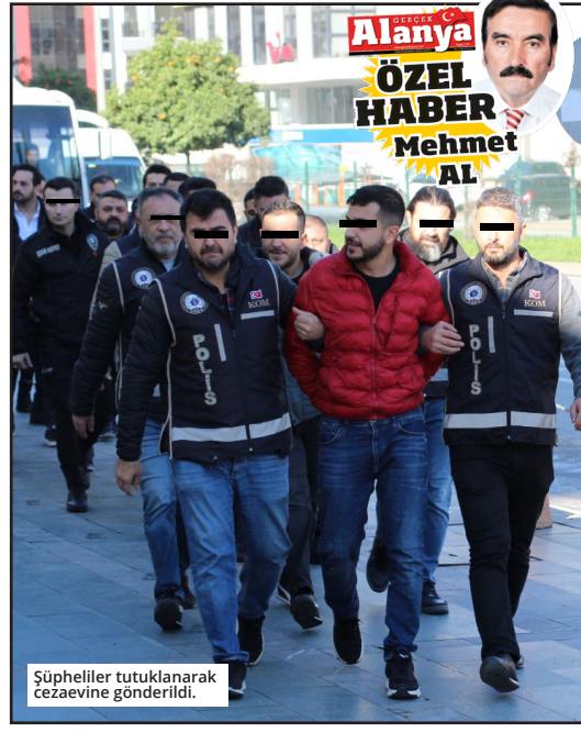
Şüpheliler tutuklanarak cezaevine gönderildi.

şüphelilerin tamamını tutuklayarak cezaevine gönderdi. ● MEHMET AL