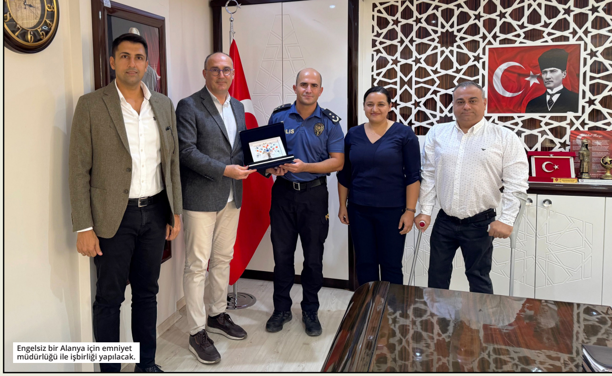
Engelsiz bir Alanya için emniyet müdürlüğü ile işbirliği yapılacak.