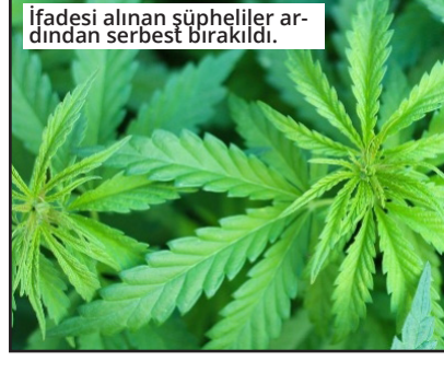
İfadesi alınan şüpheliler ardından serbest bırakıldı.

çalışmada T.D.'nin üzerinde 8 gram metamfetamin ile uyuşturucu kullanma aparatı, M.A.'ya ait oto tamirhanesinde 1 gram esrar, M.B.'nin üzerinde ise 13 gram metamfetamin ele geçirildi. Üzerlerinde ve iş yerinde uyuşturucu madde bulunan şüpheliler T.D., M.A., ile M.B. ekipler tarafından gözaltına alındı. İfadeleri alınan şüpheliler ardından serbest bırakıldı. ● MEHMET AL