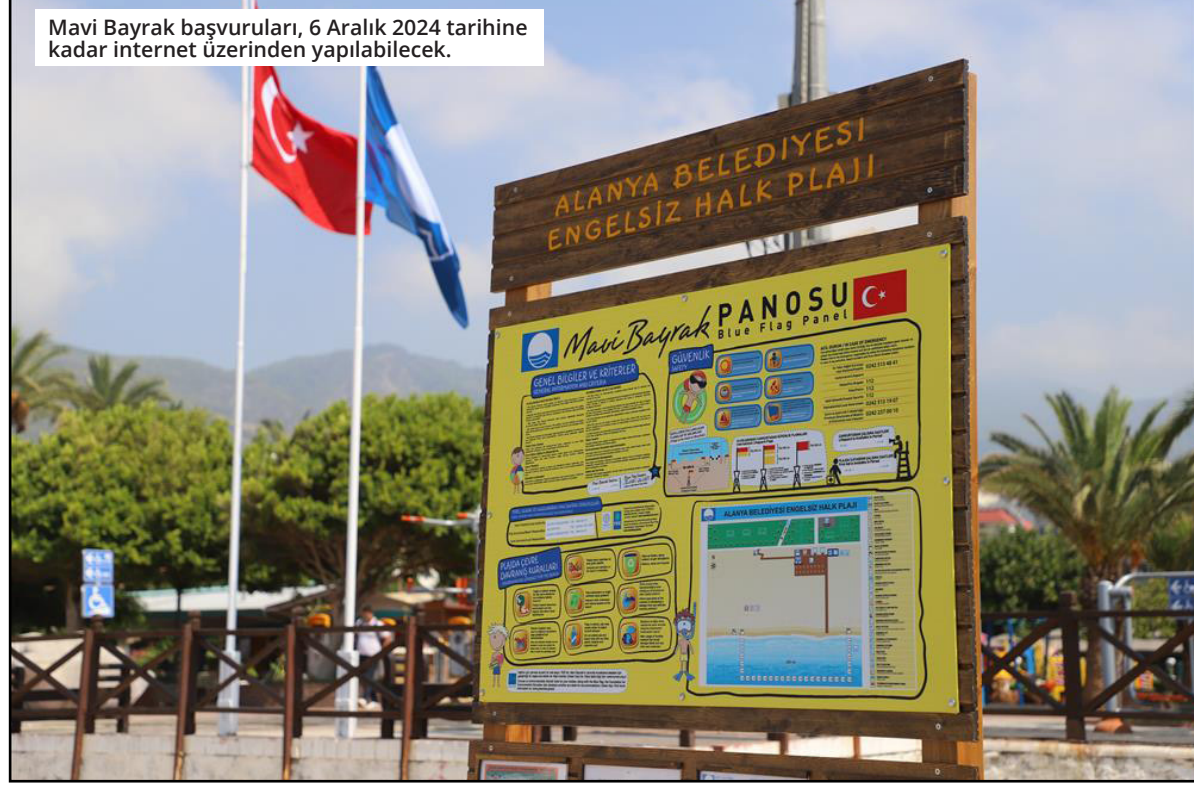
Mavi Bayrak başvuruları, 6 Aralık 2024 tarihine kadar internet üzerinden yapılabilecek.

Turizm kalitesinin artırılması ve sürdürülebilir çevre çalışmalarını için önemli bir göstergesi olan mavi bayrak programının 2025 yaz başvuruları başladı. Tüm plaj, marina ve yatların her yıl mavi bayrak alabilmek için güncellenen ar yüzü ile http://www.mavibayrak.org.tr/ online üzerinden başvuru yapılması gerekiyor. Başvurular çevre eğitimi, çevre yönetimi, güvenlik, donanım ve hizmetler ile ilgili kriterleri taahhüt ediyor. Sorumluların, başvuru formunda yıl içerisinde yapmış oldukları çevre eğitim etkinlikleri ve bilinçlendirme dosyaları, deniz suyu analiz raporları, hassas doğal alan ile çevre bilgilerinin yer aldığı ve uluslararası jüri tarafından ele alınacak konuları kapsıyor. Öte yandan Alanya Belediyesi Çevre Koruma ve Kontrol Müdürlüğü'nden 2025 Mavi Bayrak başvurusu için detaylı bilgi alınabilecek. ● DAMLA ERCİYAS