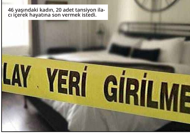
46 yaşındaki kadın, 20 adet tansiyon ilacı içerek hayatına son vermek istedi.

Alanya'da bir otelde konaklayan Alman kadın turist kendisini iyi hissetmediğini söylemesinin ardından yatak odasında ölü bulundu. Olay, Türkler Mahallesi'nde meydana geldi. Türkler'de bulunan bir otelde arkadaşları ile birlikte tatil yapan Alman uyruklu C.I.A. (58) isimli kadın yatak odasında ölü bulundu. C.I.A.'nın yatağında hareketsiz şekilde yattığının görülmesi üzerine hemen 112 Acil Çağrı Merkezi'ne ihbarda bulunuldu. İhbar üzerine otele sağlık ve jandarma ekipleri sevk edildi. Sağlık ve jandarma ekiplerinin yaptıkları incelemede C.I.A.'da herhangi bir suça yönelik delile rastlanılmadı. Jandarmanın arkadaşları ile yaptıkları görüşmede C.I.A.'nın kendini iyi hissetmediği için odasına çıkmak istediğini söylediği ve öğle yemeğinden önce alkol kullandığı belirlendi. C.I.A.'nın yatağının yanında ise çeşitli markalarda çok sayıda ilaç tableti bulundu. Cumhuriyet Savcısı tarafından C.I.A.'nın ölümü şüpheli bulunarak cenazesi Adli Tıp Kurumu'na sevk edildi. ● MEHMET AL