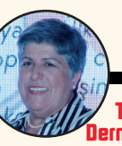
Türkiye Kadın Dernekleri Federasyonu Genel Başkanı Canan Güllü