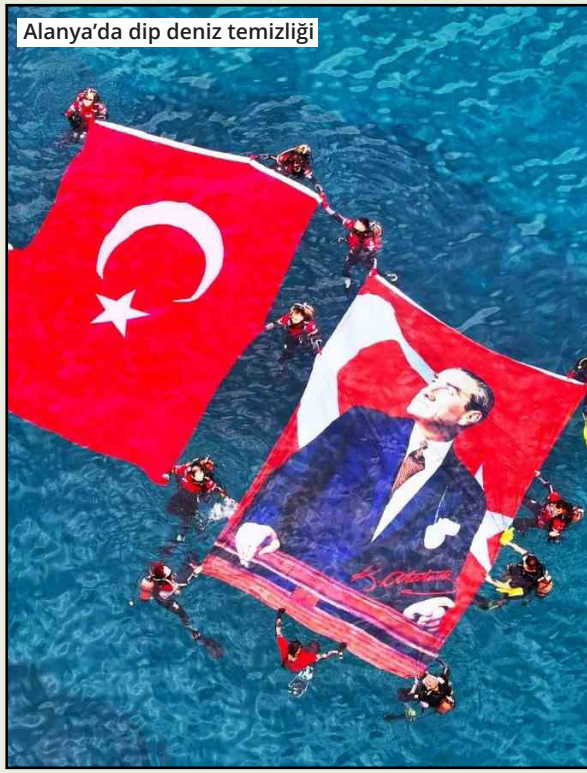
Alanya'da dip deniz temizliği