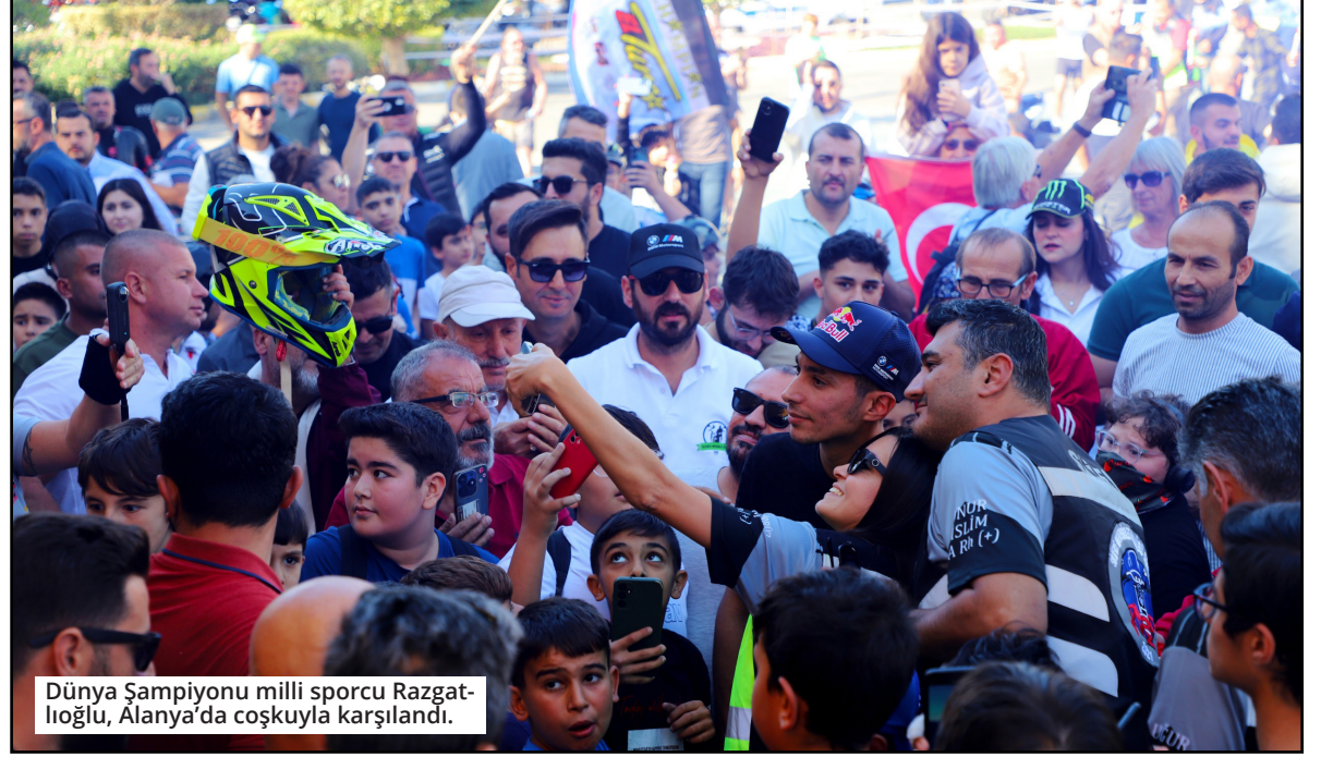
Dünya Şampiyonu milli sporcu Razgatlıoğlu, Alanya'da coşkuyla karşılandı.