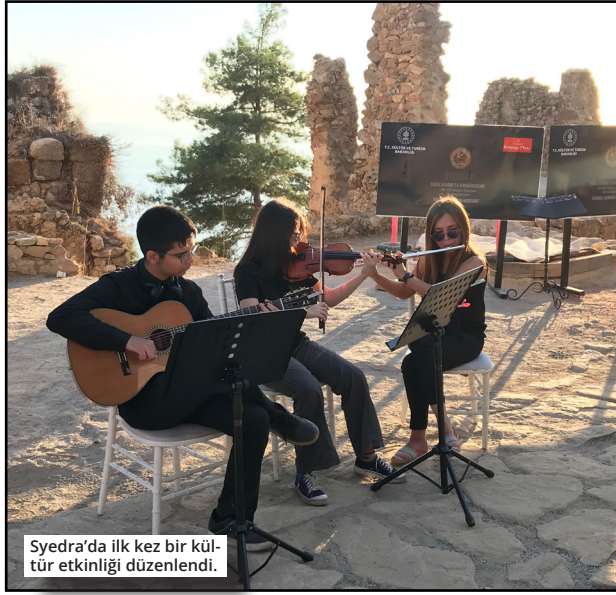
Syedra'da ilk kez bir kültür etkinliği düzenlendi.