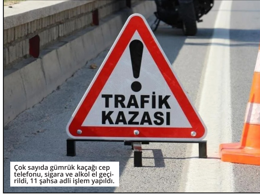
Çok sayıda gümrük kaçağı cep telefonu, sigara ve alkol el geçirildi, 11 şahsa adli işlem yapıldı.

zemine düşerek yaralandı. Kazanın ardından otomobil sürücüsü bir süre şoka girerek aracından inemedi. Kaza anı bölgedeki bir iş yerinin güvenlik kamerasına saniye saniye yansdı. Kazayı gören çevredekiler hemen 112 Acil Çağrı Merkezi'ne ihbarda bulundu. İhbar üzerine bölgeye sağlık ve jandarma ekibi sevk edildi. Kazada yaralanan motosiklet sürücüsü ambulans ile hastaneye kaldırılarak tedavi altına alındı. ● MEHMET AL