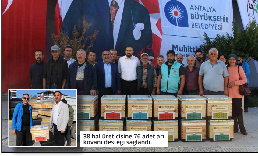
38 bal üreticisine 76 adet arı kovanı desteği sağlandı.

Antalya Büyükşehir Belediyesi Gazipaşa Kültür Merkezi'nde gerçekleştirilen dağıtımda büyük bir özenle hazırlanmış arı kovaneleri üreticilere teslim edildi. Arıncılık yapılan desteklemeden duydukları memnuniyeti ifade ederek Başkan Muhtinin Böcek'e teşekkür etti. Antalya Büyükşehir Belediyesi Tarımsal Hizmetler Dairesi Başkanlığı Kırsal Kalkınma ve Kooperatifçilik Şube Müdürlüğü yetkilileri, arıncılık faaliyeti yaptığına dair belgesi olan ve başvuruda bulunan üreticilere kovan desteği sağlanmaya devam edileceği bilgisini verdi. ● İHA