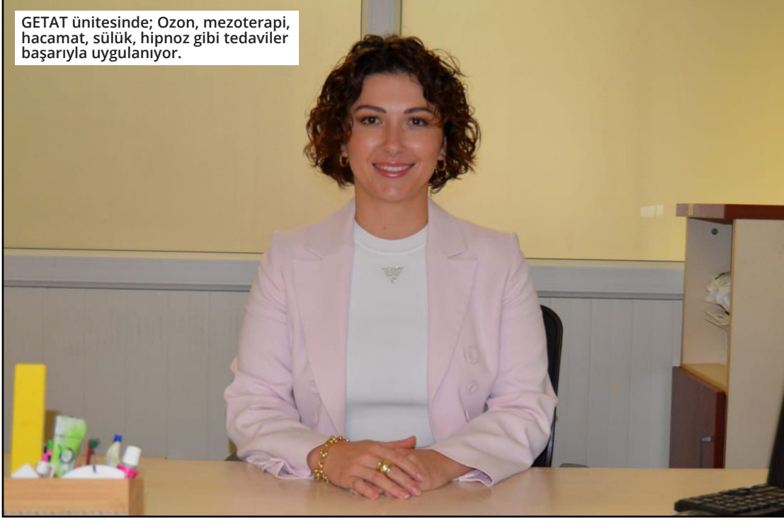
GETAT ünitesinde; Ozon, mezoterapi, hacamat, sülük, hipnoz gibi tedaviler başarıyla uygulanıyor.

Mezoterapi tedavisi ile ilgili bilgiler aktaran Dr. Dağışan, Mezoterapi çeşitli amaçlarla düşük dozda hazırlanan ilaçların, mezoterapi iğneleri ile derinin orta kısmına enjekte edilmesidir. GETAT Ünitemizde mezoterapi işlemi tıbbi endikasyonlarla uygulamaya başladık. Migren, akut ve kronik ağrıları semptomlarında mezoterapi tedavisi yapmaktayız. Gebelere, emziren annelere, inme-felç