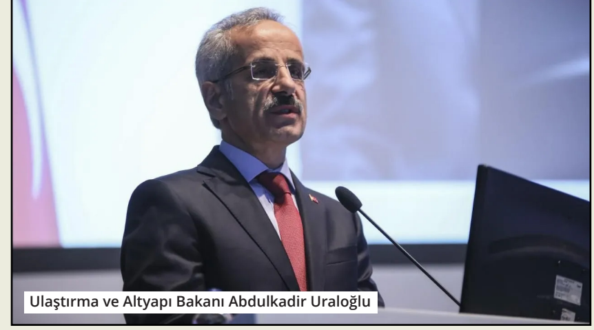
Ulaştırma ve Altyapı Bakanı Abdulkadir Uraloğlu

Ulaştırma ve Altyapı Bakanı Abdulkadir Uraloğlu, Antalya'daki ulaşım projeleri hakkında önemli açıklamalar yaptı. 2002 yılından bu yana Antalya'ya 190,5 milyar lira yatırım yapıldığını belirten Uraloğlu, bölünmüş yol uzunluğunun 197 kilometreden 715 kilometreye çıkarıldığını açıkladı. Ayrıca, Antalya şehir içi trafiğini rahatlatmak için batı çevre yolu ve çeşitli tünel projelerinin tamamlandığına dikkat çekti. Antalya'yı da kapsayan projeler arasında Demirkapı Tüneli ve Alanya-Kuşyuvası-Taşkent Yolu Tüneli yer alırken, Antalya'nın turizm bölgelerine ulaşım daha güvenli ve hızlı hale geldi. Uraloğlu, bu yatırımların bölge ekonomisine büyük katkı sağlayacağını vurguladı. ● HABER MERKEZİ