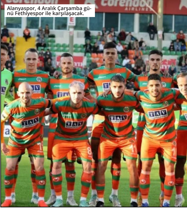
Alanyaspor, 4 Aralık Çarşamba günü Fethiyespor ile karşılaşacak.