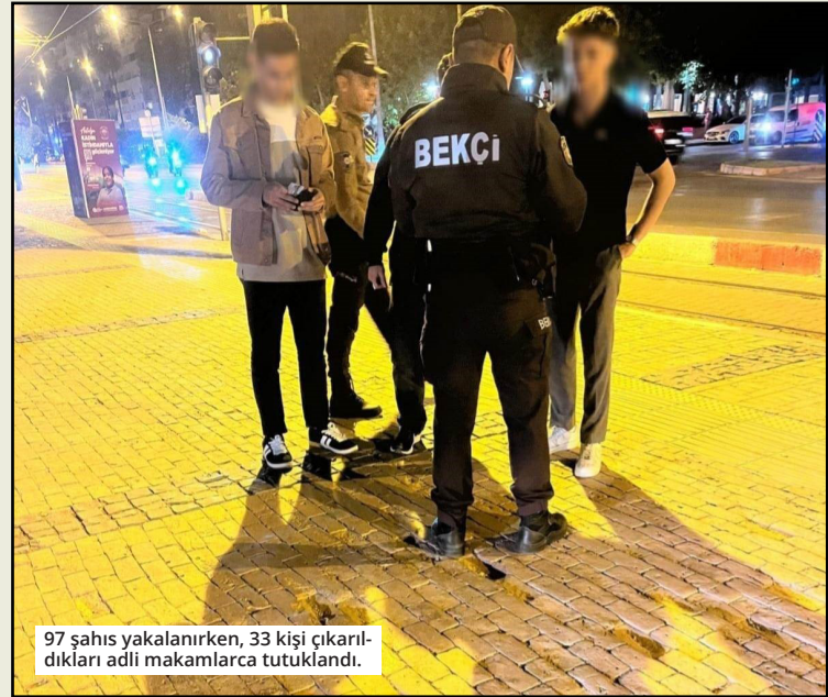
97 şahıs yakalanırken, 33 kişi çıkarıldıkları adli makamlarca tutuklandı.

Ayrıca mal ve hizmet satmak suretiyle halkı rahatsız eden şahıslara ve dilencilere yönelik ülke genelinde eş zamanlı olarak 95 ekip, 298 personelin katılımı ile 60 noktada gerçekleştirilen uygulamada; bin 328 şahıs ile 263 araç sorgulandı. 84 umuma açık yer ile 57 cami ve çevresi kontrol edilirken, 30 şahıs hakkında idari para cezası, 22 araç sürücüsüne ise cezai işlem gerçekleştirildi. Yüksek Öğrenim Kredi ve Yurtlar Kurumu çevrelerinde yapılan denetimlerde ise ekipler tarafından 66 Kız Öğrenci Yurdu ve çevresi edildi. Kontrollerde, 5 bin 332 şahıs ve bin 86 araç sorgulanırken, 39 şahsa idari para cezası uygulandı. ● İHA