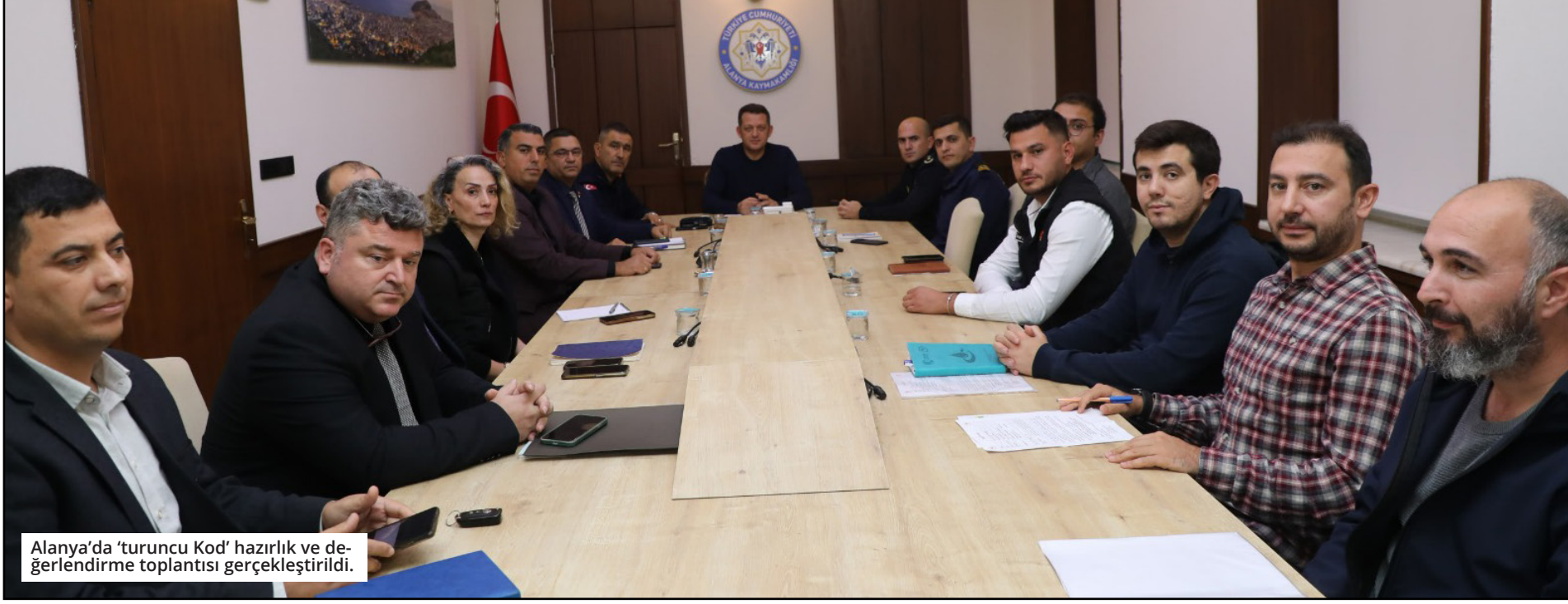
Alanya'da 'turuncu kod' hazırlık ve değerlendirme toplantısı gerçekleştirildi.