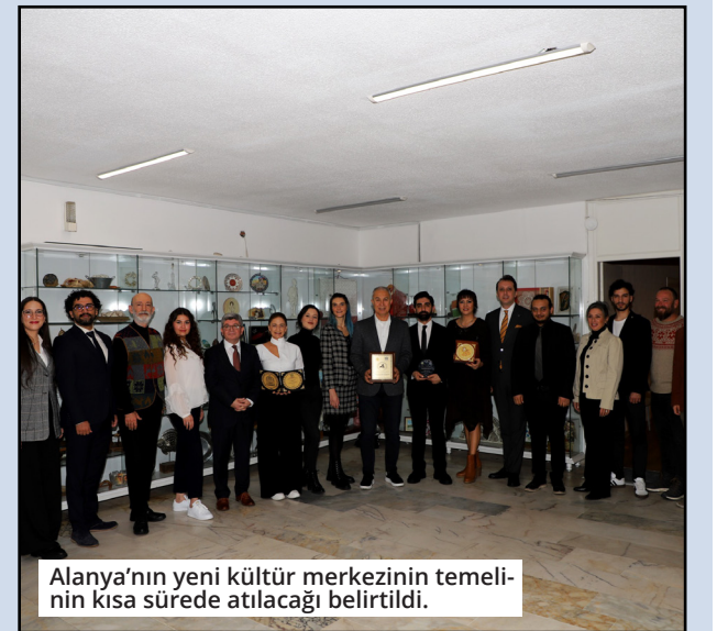
Alanya'nın yeni kültür merkezinin temelini kısa sürede atılacağı belirtildi.