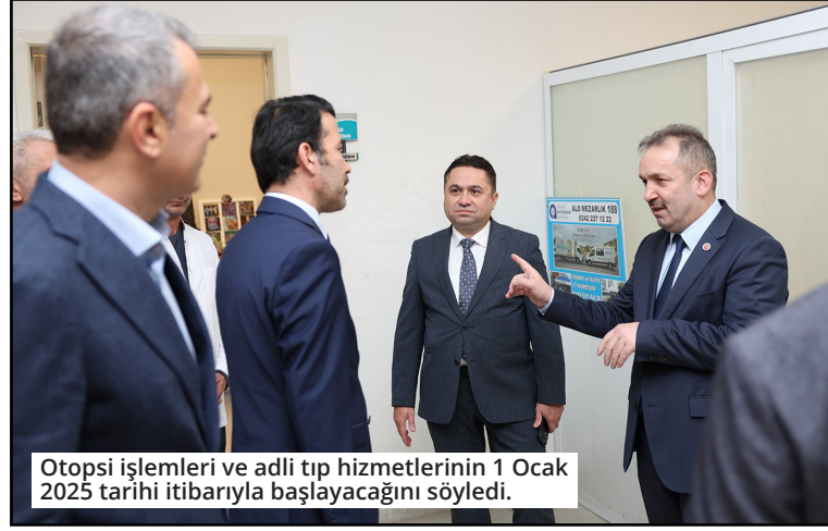
Otopsi işlemleri ve adli tıp hizmetlerinin 1 Ocak 2025 tarihi itibarıyla başlayacağını söyledi.