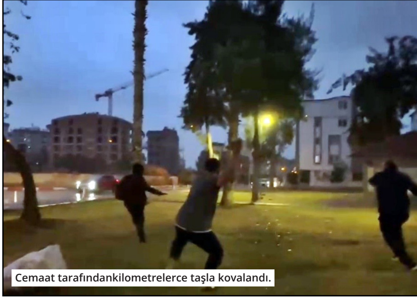
Cemaat tarafından kilometrelerce taşla kovalandı.

Kovalamaca, ara sokaklarda sürerken, inatçı cemaatten daha fazla kaçamayacağını anlayan madde bağımlısı, sirenlerini çalarak karşı yönden gelen polis aracını durdurarak kendisi arka koltuğa attı. Aracın çevresini saran cemaat polise yaşadıklarını anlatırken, şahıs elindeki bıçağı araçtan dışarıya attı. Bir vatandaş kendilerini dakikalarca koşturan şahsa tekme attı, polis olası linç girişimine karşı adamı polis aracına geri koydu. Polis camide çalışma başlatırken, şahıs ifadesi alınmak üzere polis merkezine götürüldü.