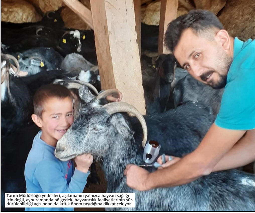
Tarım Müdürlüğü yetkilileri, aşılamının yalnızca hayvan sağlığı için değil, aynı zamanda bölgedeki hayvancılık faaliyetlerinin sürdürülebilirliği açısından da kritik önem taşıdığına dikkat çekiyor.