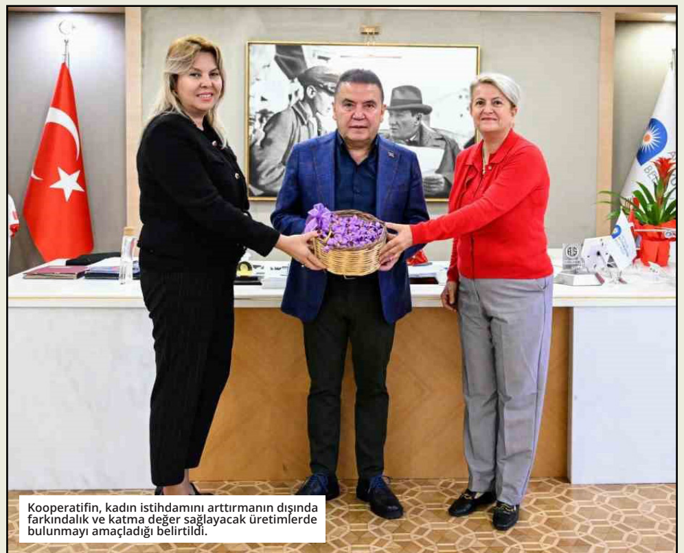
Kooperatifin, kadın istihdamını artırmanın dışında farkındalık ve katma değer sağlayacak üretimlerde bulunmayı amaçladığı belirtildi.

Antalya Büyükşehir Belediyesi Elmalı bölgesinde safran üretimini teşvik etmek amacıyla Toprakana Kadın Kooperatifi'ne safran soğanı hibe etti. 2022 yılında Elmalı Belediyesine ait 19 dönüm araziye kiralanayan kooperatif 2023 yılında 19 dönümlük arazinin 4 dönümüne safran dikimi gerçekleştirdi. Üçüncü yılın sonunda ilk dikim yapılan alanda yetişen soğanların 19 dönüm arazinin geri kalan 15 dönümüne ekilmesi planlanıyor. Yetiştirilen soğanların bir süre sonra köydeki diğer üreticilere de satılarak Elmalı'da safran üretiminin artırılması Safranbolu'dan sonra Elmalı'nın safran üreten ilçe olarak tanıtılması hedefleniyor. ● İHA