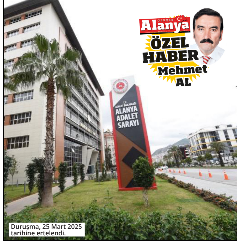
Duruşma, 25 Mart 2025 tarihine ertelendi.

Alanya 1. Ağır Ceza Mahkemesi heyeti, gasp ve kişiyi hürriyetinden yoksun kılma suçundan yargılanan tutuklu sanıklar Erdal B. ve Emre C.'nin tutukluluk hallerinin devamına karar verdi. Olayda adı geçen kişilerin ikamet adreslerinin tespit edilerek, bir sonraki celseye kadar hazır edilmeleri talep edildi. Duruşma, 25 Mart 2025 tarihine ertelendi. ● MEHMET AL