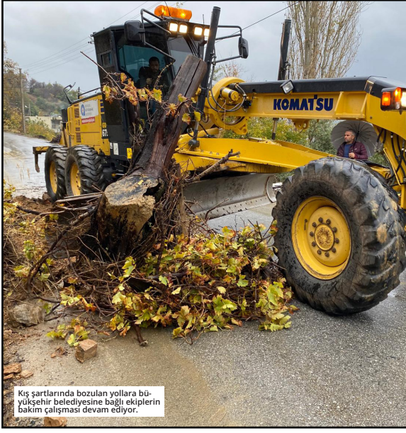
Kış şartlarında bozulan yollara Büyükşehir Belediyesine bağlı ekiplerin bakım çalışmaları devam ediyor.

Büyükşehir, yağış ve fırtına nedeniyle bozulan yollarda bakım, temizlik ve onarım çalışması yapıyor. Antalya Büyükşehir Belediyesi Kırsal Hizmetler Dairesi Başkanlığı Alanya ekipleri, ilçenin doğu, batı ve kuzeyinde yağış ve fırtınadan etkilenen yollarda çalışmalarına devam ediyor. Burçaklar Mahallesi'nde yağış sonrası yola düşen kaya, toprak ve ağaç dal ve kütükleri iş makinesi aracılığıyla yoldan kaldırıldı. Gümüşgöze Mahallesi'nde ise şarapol temizliği ve yola bakım çalışması gerçekleştirildi. Mahmutseydi Mahallesi grup yolunda da şarapol temizliği ve yol bakımının yanı sıra yolu içine devrilen ağaç kaldırıldı. ● BŞB/BÜLTEN