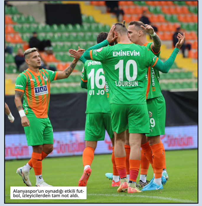
Alanyaspor'un oynadığı etkili futbol, izleyicilerden tam not aldı.