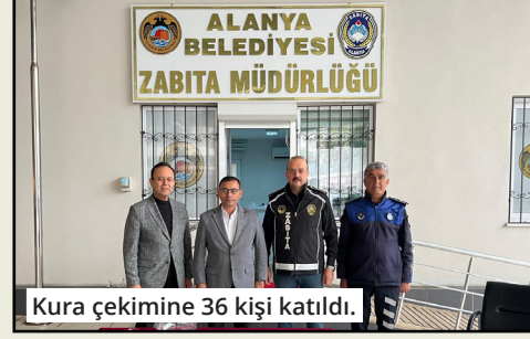
Kura çekimine 36 kişi katıldı.