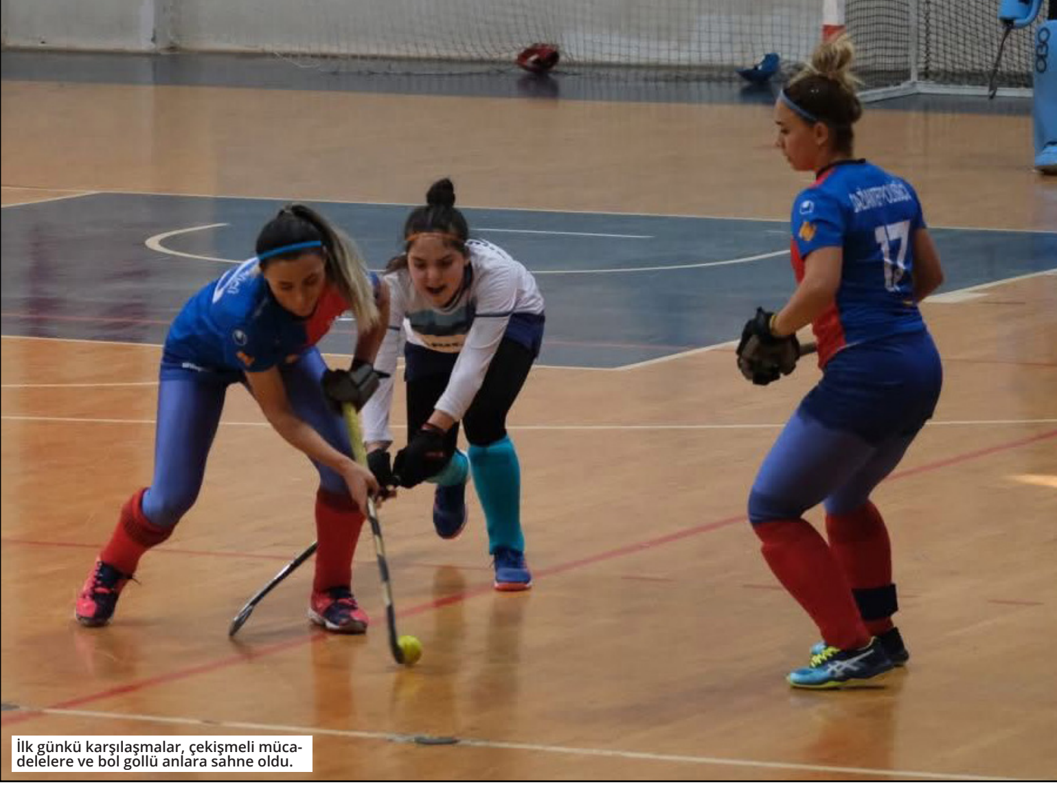
İlk günkü karşılaşmalar, çekişmeli mücadelelere ve bol gollü anlara sahne oldu.