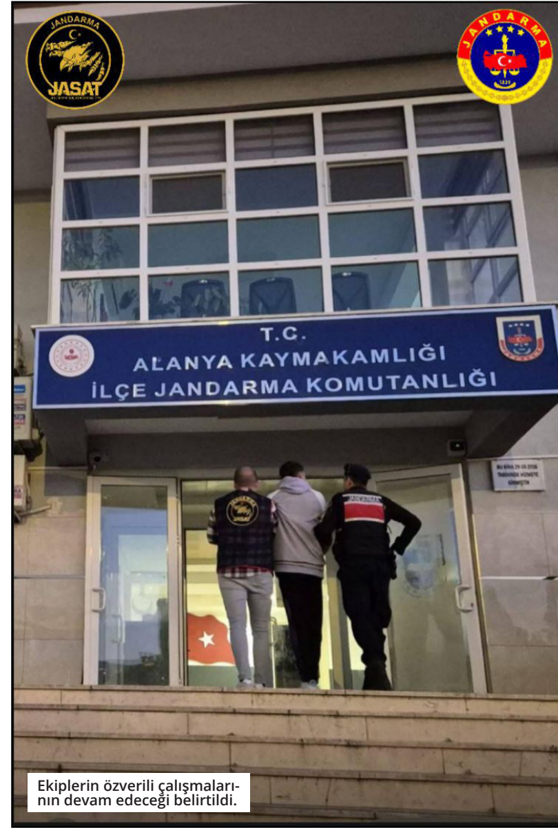
Ekiplerin özverili çalışmalarının devam edeceği belirtildi.

samında, 10 yıl ve üzeri hapis cezası bulunan 2 şüpheli, 5-10 yıl arası hapis cezası bulunan 3 şüpheli ve 0-5 yıl arası hapis cezası bulunan 24 şüpheli olmak üzere toplamda 164 şahıs ele geçirildi. ● MEHMET AL