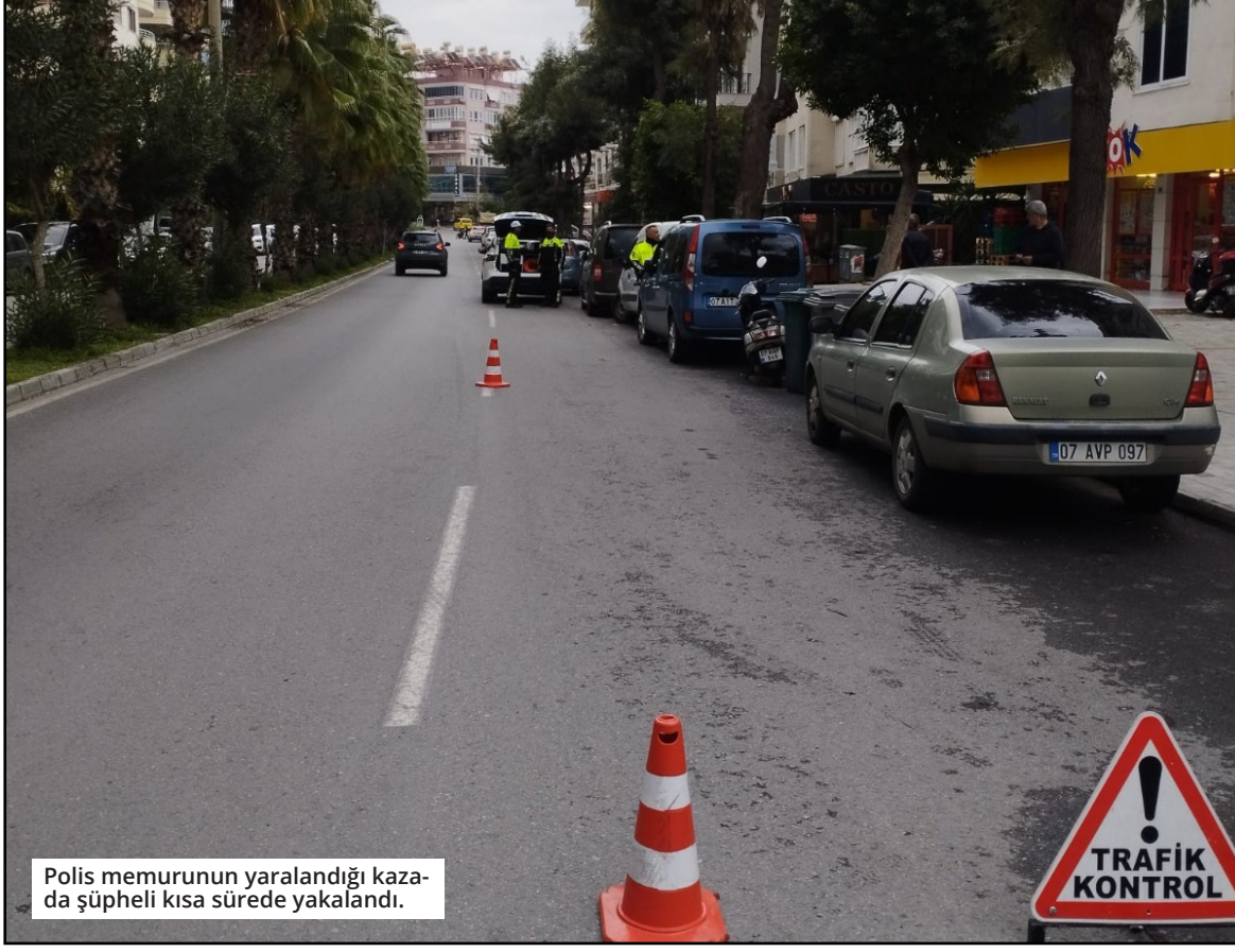
Polis memurunun yaralandığı kazada şüpheli kısa sürede yakalandı.

Oluy, Alanya'nın Güllerpınarı Mahallesi, Ahmet Tokuş Caddesi üzerinde meydana geldi. Alanya Emniyet Müdürlüğü ekipleri, cadde üzerinde uygulama yaparken polisin "dur" ihtarına uymayan S.Ç.B. (16), motosikletiyle Fatih N. isimli polis memuruna çarptı. Çarpmanın ardından motosikleti bırakıp yaya olarak kaçmaya başlayan genç, yaklaşık 30 metre ileride ekipler tarafından kısıvrak yakalandı. Olayda yaralanan polis memuruna ilk müdahale çalışma arkadaşları tarafından yapılırken, bölgeye sevk edilen sağlık ekipleri tarafından Alanya Eğitim ve Araştırma Hastanesine kaldırıldı. Yapılan sağlık kontrolünde, yaralı polis memurunun durumunun iyi olduğu öğrenildi. Gözaltına alınan genç şüpheli, hastanede sağlık kontrolünden geçirildikten sonra Alanya Emniyet Müdürlüğü Çocuk Büro Amirliği'ne sevk edildi. Olayla ilgili soruşturma sürdürülüyor. ● MEHMET AL