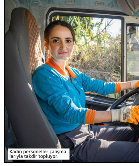
Kadın personeller çalışmalarına takdir topluyor.