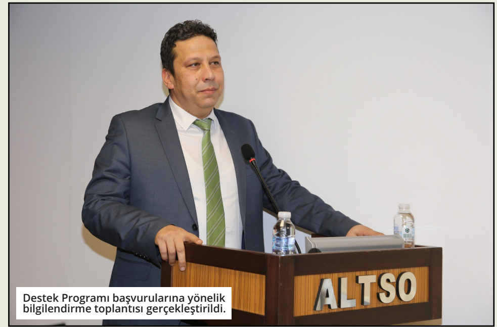
Destek Programı başvurularına yönelik bilgilendirme toplantısı gerçekleştirildi.