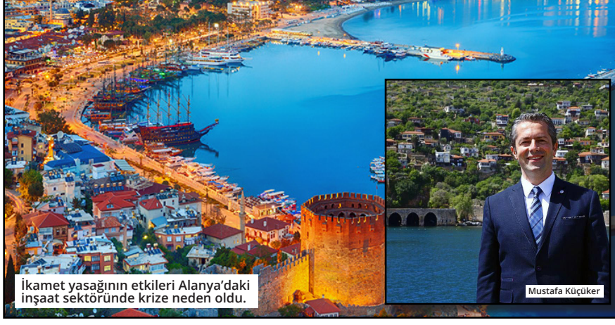
İkamet yasağının etkileri Alanya'daki inşaat sektöründe krize neden oldu.