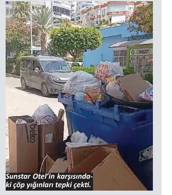
Sunstar Otel'in karşısında çöp yığınları tepki çekti.

Bölge halkından bir kişi, “Burada sadece biz yaşamıyoruz, on binlerce turist geliyor. Otelin hemen karşısında bu görüntünün olması çok utanç verici. Defalarca belediyeyi aradık, kimse ilgilenmedi. Yetkililerden acil çözüm bekliyoruz” diyerek duruma tepki gösterdi. Bir başka vatandaş ise, “Yaz aylarında zaten hava çok sıcak, çöpler de üstüne eklenince dayanılmaz bir koku oluşuyor. Pencerelemizi açamıyoruz. En kısa sürede bu sorunun çözümmesini istiyoruz” ifadelerini kullandı.