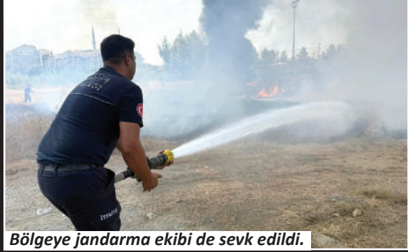
Bölgeye jandarma ekibi de sevk edildi.

Alanya'da otluk alanda çıkan yangın hızlı müdahale sonucu söndürüldü. Yangında alanda bulunan fiber malzemeler de kullanılamaz hale geldi.