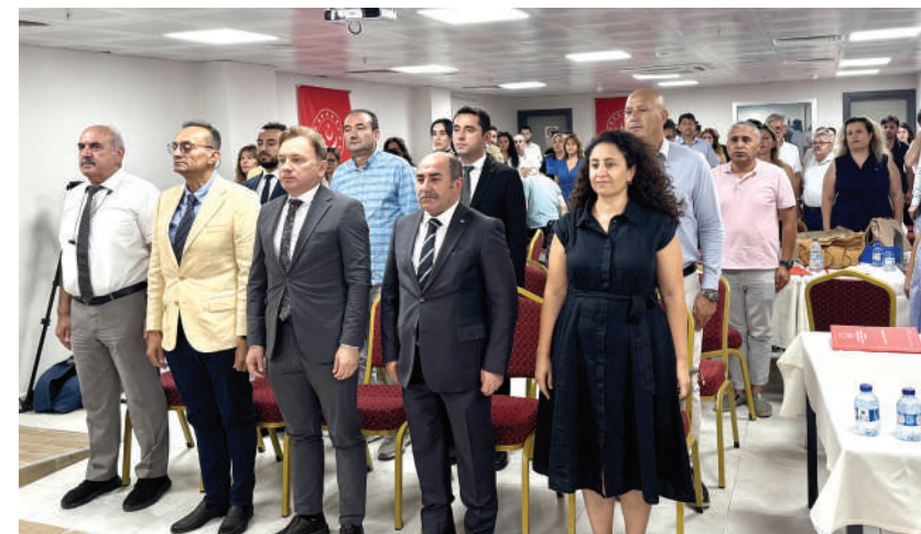
Antalya'da yaşlılara yönelik çalışmaların ele alındığı çalıştay düzenlendi.