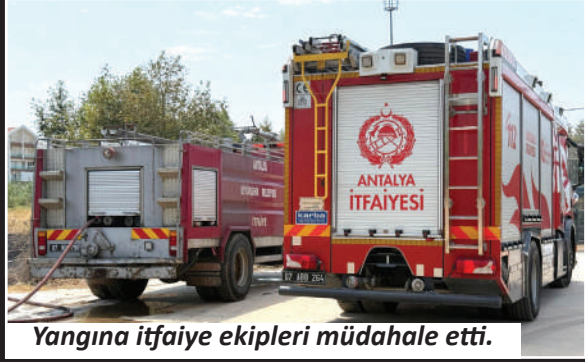
Yangına itfaiye ekipleri müdahale etti.