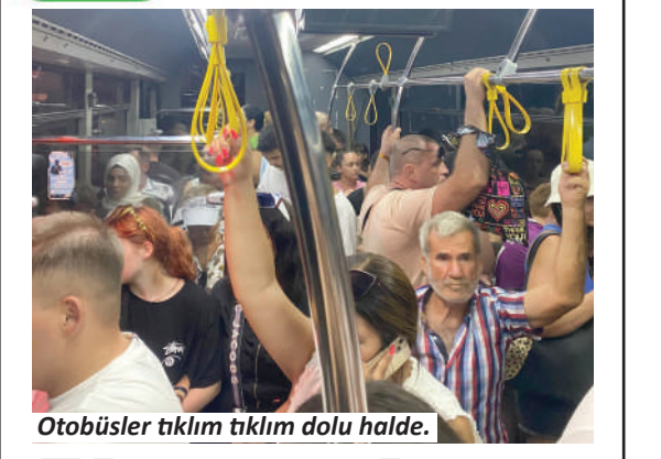
Otobüsler tıklım tıklım dolu halde.