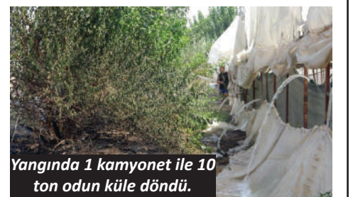
Yangında 1 kamyonet ile 10 ton odun küle döndü.

İhbar üzerine olay yerine çok sayıda itfaiye ve polis ekibi sevk edilirken alevler boş arazi içerisinde satış için hazırlanan odunlar ve depo olarak kullanılan atıl durumdaki kamyonet ile malzemelere sıçradı. Mahallelinin tüm çabalarına rağmen yangının sıçradığı odun ve atıl durumdaki kamyonet ile malzemeler küle döndü. İtfaiye ekiplerinin yaklaşık 45 dakikalık çalışmasının ardından yangın kontrol altına alınırken, ekipler bölgede soğutma çalışması yaptı. Dumanları görerek ilk müdahaleyi yapan mahalle sakinlerinden Aziz Uysal, Yoğun şekilde dumanları görünce koşarak geldik. İtfaiyeyi aradık hemen gelip kısa sürede söndürdüler. Sadece bir oduncunun malzemelerinde zarar var. Eski kullanılmayan bir araç ve odunlar yandı" dedi. Ekipler, yangının çıkış nedeni ile ilgili inceleme başlattı. - İHA