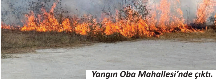
Yangın Oba Mahallesi'nde çıktı.