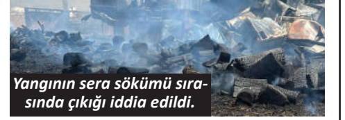
Yangının sera sökümü sırasında çıkığı iddia edildi.

Antalya'da sera sökümü sırasında spiralden çıkan kıvılcıklar nedeniyle başladığı iddia edilen yangında 1 kamyonet ve atık malzemelerin yanı sıra satış amacıyla depolanan yaklaşık 10 ton odun küle döndü.