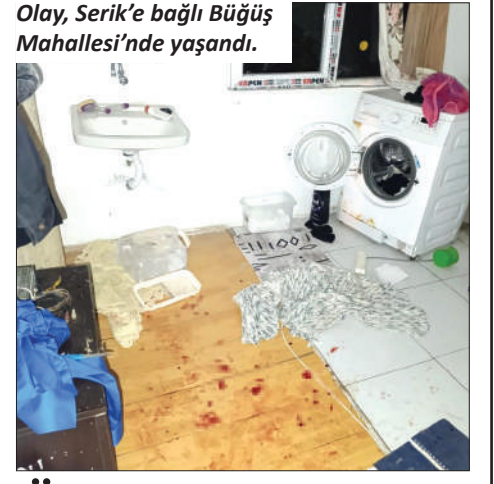
Olay, Serik'e bağlı Büğüş Mahallesi'nde yaşandı.

bildirdi. İhbar üzerine olay yerine ambulans ve jandarma sevk edildi. Sağlık ekiplerinde ilk müdahalesi olay yerinde yapılan motosiklet sürücüsü hastaneye kaldırıldı. F.S'nin sağlık durumunun ciddiyetini koruduğu öğrenildi. – Yasemin Kaya