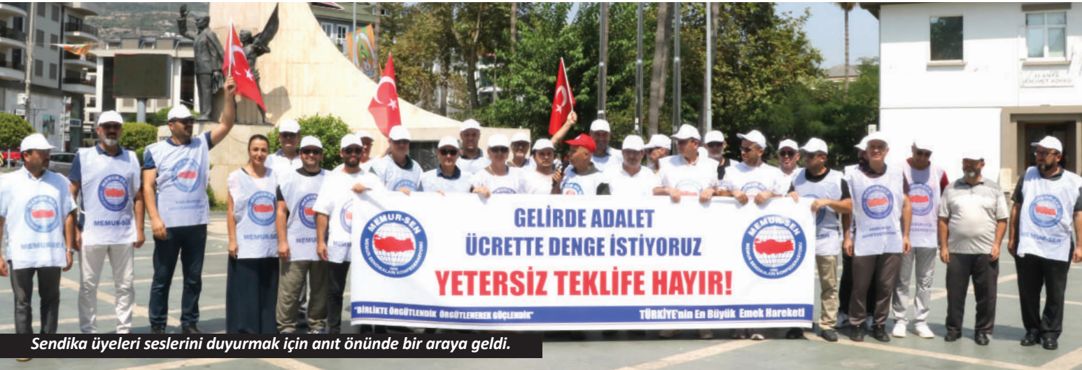
Sendika üyeleri seslerini duyurmak için anıt önünde bir araya geldi.

Sayın Özel hiç merak etmesin. Yolsuzluk operasyonları neticesinde belediyeler rüşvetçi çetelerden, CHP ahtapotun kollarından, Türkiye safralarından, kendisi de prangalarından kurtulacak. Adalet tecelli ettiğinde sadece kendisi değil, bir avuç muhterisi savunmak için oradan oraya sürüklediği CHP’li vatandaşlarımız da rahat edecek.”