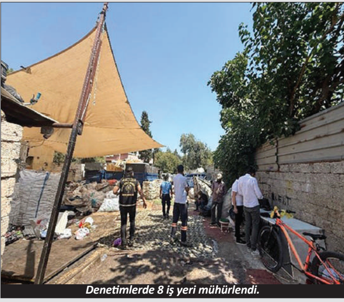
Denetimlerde 8 iş yeri mühürlendi.