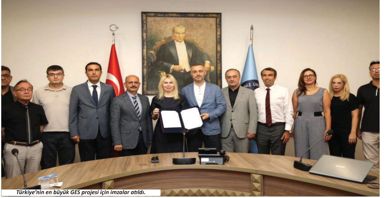
Türkiye'nin en büyük GES projesi için imzalar atıldı.