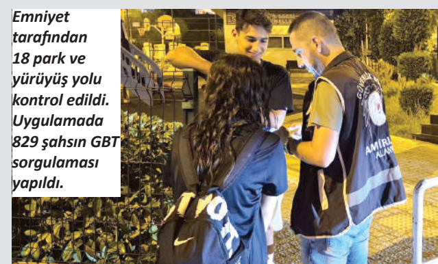
Emniyet tarafından 18 park ve yürüyüş yolu kontrol edildi. Uygulamada 829 şahsın GBT sorgulaması yapıldı.

25 aracın sorgulandığı uygulamada yakalama kaydı bulunan 1 motosiklet otoparka çekilirken, Kabahatler Kanunu uyarınca 1 şahsa da idari yaptırım uygulandı. Alanya İlçe Emniyet Müdürlüğü ekipleri tarafından park, bahçe ve yürüyüş yollarında kapsamlı denetim gerçekleştirildi. Uygulama neticesinde 18 park ve yürüyüş yolu kontrol edilerek 829 şahsın GBT sorgulaması yapıldı. Uygulamada 'Basit Yaralama', 'Spor Müsabakalarına Dair Kanuna Muhalefet', 'Hırsızlık ve Taksirle Ölüme Neden Olma' suçlarından aranan toplam 4 şahıs yakalanarak adli makamlara sevk edildi. 25 aracın sorgulandığı uygulamada yakalama kaydı bulunan 1 motosiklet otoparka çekildi. Kabahatler Kanunu uyarınca 1 şahsa da idari yaptırım uygulandı. Alanya İlçe Emniyet Müdürlüğü'nden yapılan açıklamada vatandaşların huzur ve güvenliği için denetimlerin edeceği ifade edildi. – Alanya Kaymakamlığı / Bülten