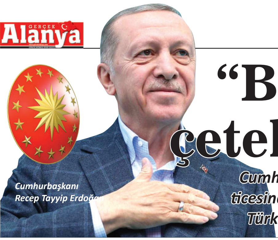
Cumhurbaşkanı Recep Tayyip Erdoğan