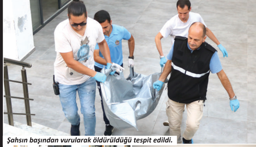
Şahsın başından vurularak öldürüldüğü tespit edildi.