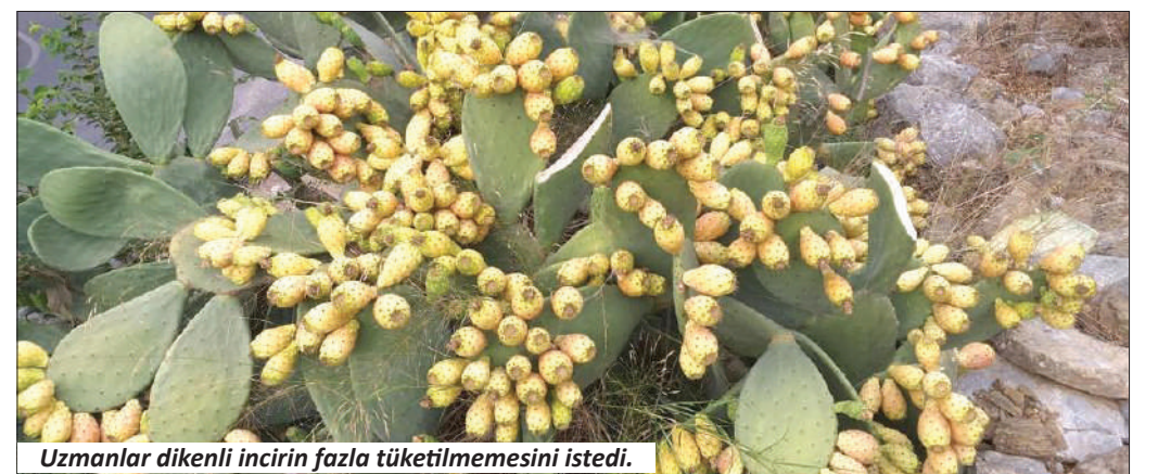
Uzmanlar dikenli incirin fazla tüketilmemesini istedi.

Dikenli incirin çözünmez lif ve sert çekirdekler içerdiğini belirten Dr. Demir, "Aşırı miktarda tüketildiğinde ve yeterince su