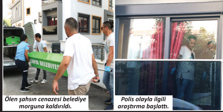
Ölen şahsın cenazesi belediye morguna kaldırıldı.