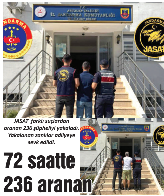
JASAT farklı suçlardan aranan 236 şüpheli yakalandı. Yakalanan zanlılar adliyeye sevk edildi.