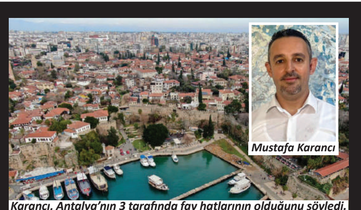
Karancı, Antalya’nın 3 tarafında fay hatlarının olduğunu söyledi.