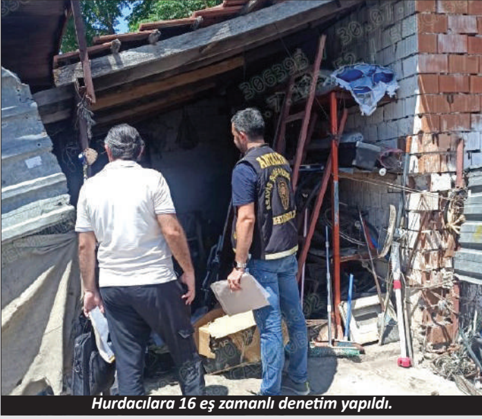
Hurdacılar 16 eş zamanlı denetim yapıldı.

Hurdacı ve spotçulara yönelik denetimlerde bin 305 kişi ve 525 araç sorgulandı. İlgili kurum görevlilerince 8 iş yeri faaliyetten men edildi, yüklü miktarda cezai işlem uygulandı. Uygulamalarda aranan 1 kişi ile yoklama kaçağı 1 kişi yakalanırken, aranan 1 araç ele geçirildi. Ayrıca hurda vaziyetteki 60 araç sahiplerine ulaştırıldı ya da çekiciyle kaldırıldı. 14 araca idari para cezası uygulandı. Telefon alım satımı yapan iş yerlerine yönelik denetimlerde ise 90 iş yeri kontrol edildi, 350 kişi sorgulandı. İş yerlerindeki 117 telefon incelendi, ruhsatsız olduğu tespit edilen 3 işletme hakkında yasal işlem başlatıldı. – İHA