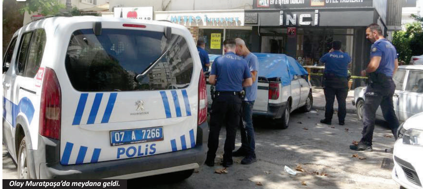
Olay Muratpaşa'da meydana geldi.

Antalya'da kendisinden haber alınamayan ve bir süredir iş yerini açmayan şahıs, kötü kokuların yayılmaya başlaması üzerine iş yerinde ölü olarak bulundu.