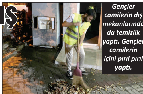
Gençler camilerin dış mekanlarında da temizlik yaptı. Gençler camilerin içini pırıl pırıl yaptı.

Sabahın erken saatlerinde bir araya gelen gönüllü gençler, camilerin iç ve dış mekanlarında temizlik yaptı. Gençler halıların süpürülmesi, rafların tozlarının alınması, camların silinmesi ve avluların temizlenmesi gibi işleri büyük bir özveriyle tamamladı. Alanya Ülkü Ocakları'ndan yapılan açıklamada, "Camilerimiz, inancımızın ve