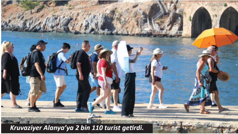
Kruvaziyer Alanya'ya 2 bin 110 turist getirdi.

Hollanda bandıralı, 285 metre uzunluğundaki 'Oosterdam' adlı kruvaziyer, Limasol'dan yola çıkarak Alanya Limanı'na ulaştı. Çoğunluğu ABD vatan-dışı olmak üzere toplam 2 bin 110 turist ve 784 personelin bulunduğu gemi limana demirledi. Gümrük işlemleri tamamlandıktan sonra turistler gemiden inerek ilçe merkezine dağıldı. Gemi saat 17.00'de Marmaris'e gitmek üzere Alanya Limanı'ndan demir aldı. - Erkan Uysal