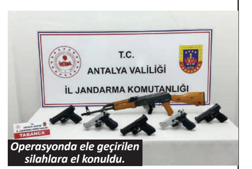
Operasyonda ele geçirilen silahlara el konuldu.

Belediyeden ihale alan bazı iş insanlarının, hak ediş ödemelerini almak veya ruhsat, imar, arsa izinleri gibi işlemleri hızlandırmak amacıyla belediye başkanı ve yakın çevresine yüklü miktarda rüşvet verdiği, paraların bir bölümünün döviz bürosu ve kuyumcular üzerinden altına çevrilerek kasalarda saklandığı, bir bölümünün ise lüks araç alımlarında kullanıldığı öne sürülmüştü. Soruşturma kapsamında para hareketleri, sahte döviz ve altın işlemleri ile lüks araç alımlarının tümü mercek altına alınırken iş adamı A. Y. ve E. K.'nın da aralarında bulunduğu 17 kişiden 15'i 3 günlük gözaltı süresinin ardından emniyetteki işlemlerinin tamamlanarak bugün sabah saatlerinde adliye sevk edildi. 2 kişinin ise emniyetteki ifadelerinin ardından serbest bırakıldığı bildirildi. - İHA