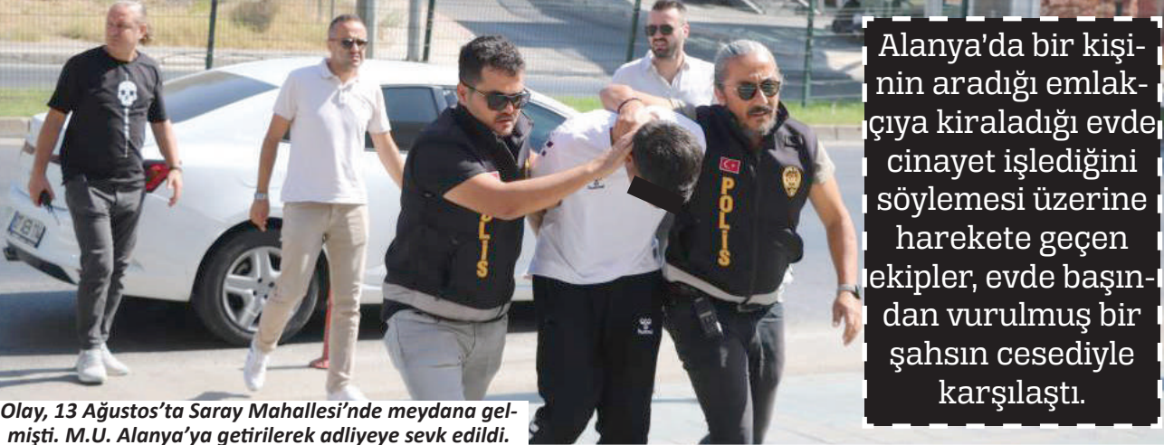
Olay, 13 Ağustos'ta Saray Mahallesi'nde meydana gelmişti. M.U. Alanya'ya getirilerek adliye sevk edildi.

Kaçan cinayet zanlısı Gümüşhane'de erkek yurdunda polis ve bekçiler tarafından yakalandı. Emniyetteki işlemlerinin ardından Alanya Adliyesi'ne sevk edilen M.U. tutuklanarak cezaevine gönderildi.