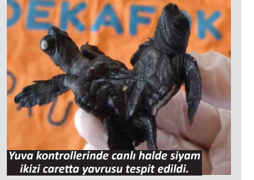
Yuva kontrollerinde canlı halde siyam ikizi caretta caretta yavrusu tespit edildi.

Yerli ürünlerin kalitesine de dikkati çeken Hüddoğlu, tüketicilere bölge ürünlerini tercih etmelerini çağırısında bulundu. Bölgede üretilen tropikal ürünlerin lezzetinin ithal ürünlerde olmadığını vurgulayan Hüddoğlu, aldığı projeleriyle üretimi desteklemeyi hedeflediklerini kaydetti. Hüddoğlu, yeni hal binasının ve sulama altyapılarının tamamlanmasıyla bölge ekonomisine milyonlarca dolarlık katkı sağlanabileceğini belirterek tropikal meyvenin hak ettiği değere ulaşması için çalıştıklarını ifade etti. Üreticilerin tropikal meyve ve yönetiminin temel nedenlerinden birinin de sebze göre iş gücünün daha az olması olduğunu dile getirdi. - Anadolu Ajansı