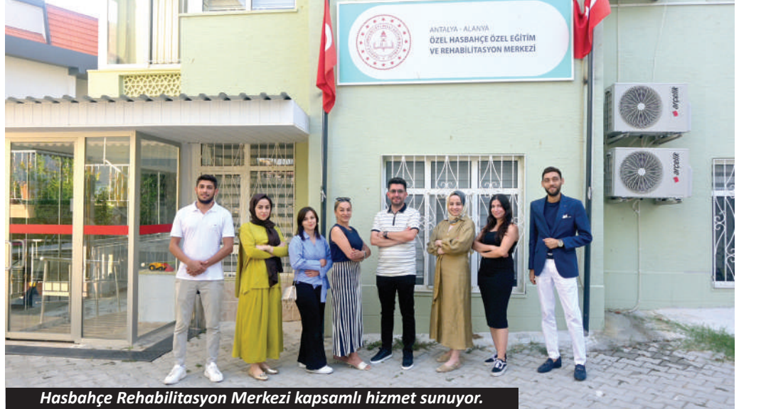
Hasbahçe Rehabilitasyon Merkezi kapsamlı hizmet sunuyor.