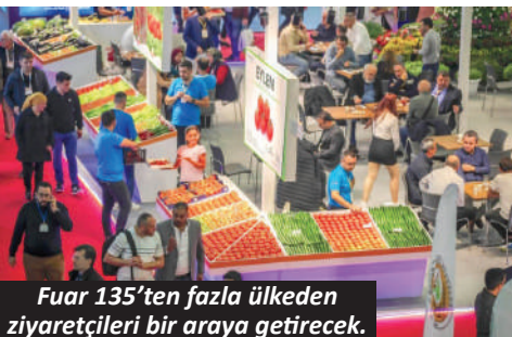
Fuar 135'ten fazla ülkeden ziyaretçileri bir araya getirecek.

Yoğun katılımcı ve ziyaretçi trafiğine hazırlık amacıyla otopark alanları genişletildi. Fuar süresince uygulanacak planlı trafik ve otopark yönetimiyle katılımcı ve ziyaretçilerin fuar alanına hızlı ve kolay ulaşması sağlanacak. Ayrıca, Telgraf Turizm üzerinden yapılacak otel rezervasyonlarında fuar alanına ücretsiz servis imkanı da sunulacak. - İHA