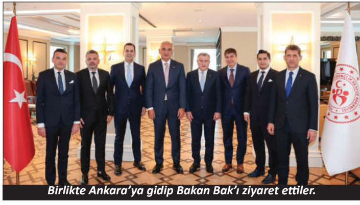
Birlikte Ankara'ya gidip Bakan Bak'ı ziyaret ettiler.

Alanya özel gereksinimli bireylerin eğitim ve gelişimine adanmış yeni bir merkeze ev sahipliği yapıyor. Ocak ayında kapılarını açan ve şubat ayında eğitim faaliyetlerine başlayan Hasbahçe Rehabilitasyon Merkezi, Milli Eğitim Bakanlığı'na bağlı olarak kapsamlı hizmetler sunuyor.