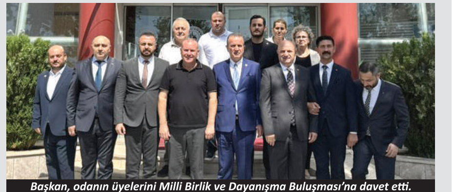
Başkan, odanın üyelerini Milli Birlik ve Dayanışma Buluşması'na davet etti.