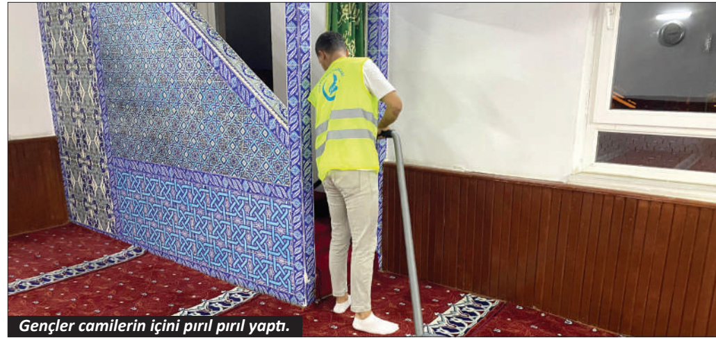
Gençler camilerin içini pırıl pırıl yaptı.