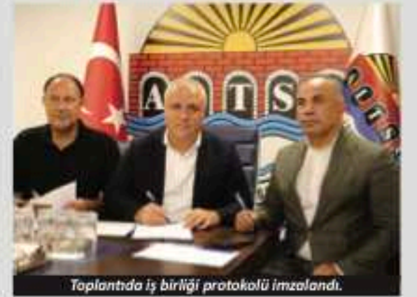
Toplantıda iş birliği protokolü imzalandı.