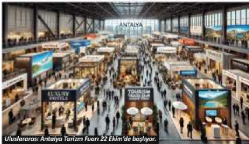
Uluslararası Antalya Turizm Fuarı 22 Ekim'de başlıyor.