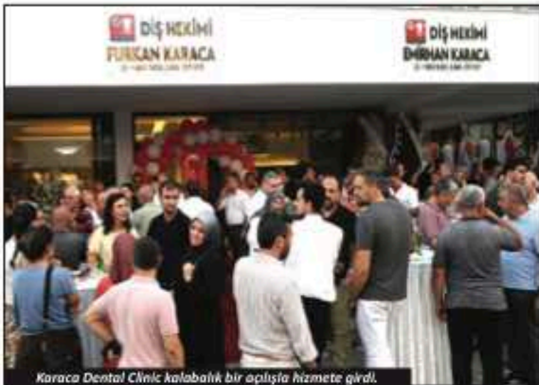
Karaca Dental Clinic kalabalık bir açılışa hizmete girdi.