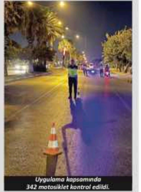
Uygulama kapsamında 342 motosiklet kontrol edildi.

Antalya'nın huzur ve güvenliğinin devamı amacıyla Asayiş Şube Müdürlüğü Motosikletli Polis Timleri (Yunus Timleri) tarafından son 1 haftada geniş kapsamlı çalışmalar yürütüldü. Çalışmalarda 56 aranan şahıs, 1 hırsızlık şüphelisi, 1 kapkaç şüphelisi ve 29 uyuşturucu madde bulundurma/kullanma/ticaretini yapmak suçundan şüpheli yakalandı. Yapılan yakalamalar sonucunda 21 adet ateşli silah, 2 adet çalıntı motosiklet, 8 bin 100 adet sentetik kannabinoid (A4) maddesi ile bir miktar esrar, kokain ve metamfetamin ele geçirildi.