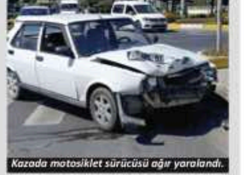
Kazada motosiklet sürücüsü ağır yaralandı.

Kaza, Manavgat Caddesi'nde meydana geldi. Edinilen bilgiye göre, Aysel K.'nin kullandığı 07 ABB 97 plakalı otomobil, Gürkan A.'nin kullandığı 06 ETR 609 plakalı motosikletle çarpıştı. Kazada ağır yaralanan motosikletli sağlık ekiplerinin olay yerindeki müdahalesinin ardından ambulansla hastaneye götürüldü. Manavgat Emniyet Müdürlüğü Trafik Denetleme Büro Amirliği ekiplerinin yaptığı kontrolde sürücü belgesi olmadığı, kask takmadığı belirlenen motosiklet sürücüsüne 19 bin 651 TL para cezası uygulandı. Kazayla ilgili inceleme başlatıldı. - İHA