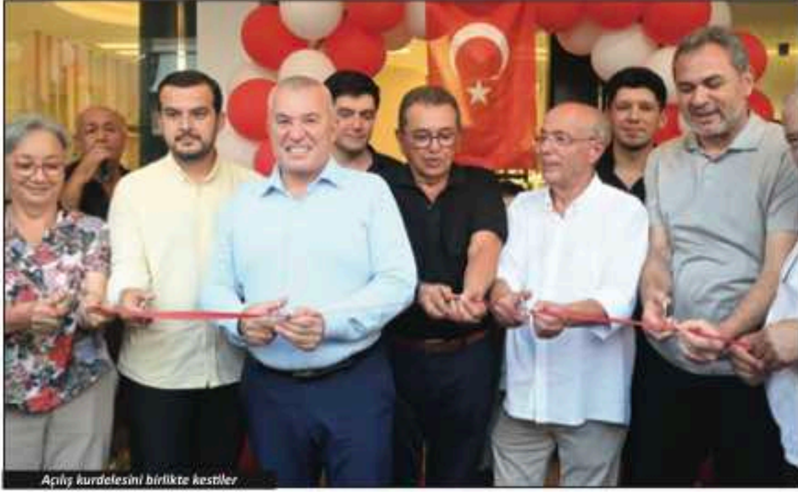
Açılış kurdelesini birlikte kestiler.