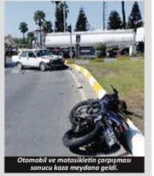
Otomobil ve motosikletin çarpışması sonucu kaza meydana geldi.

Alanya'da silahla araç kurşunlayan şüpheli polis operasyonu sonucu yakalandıktan sonra tutuklanarak cezaevine gönderildi.