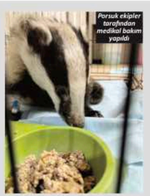
Porsuk ekipler tarafından medikal bakım yapıldı

Eğitim Sahnesi'nde turizm öğrencileri ve genç profesyonellere özel atölyeler düzenlenirken, Startup Demo Day ile turizm odaklı girişimler yatırımcılarla buluşacak. Bu yıl ilk kez düzenlenecek Tourism Design Awards, turizme değer katan özgün tasarımları uluslararası ölçekte ödüllendirerek farklı disiplinleri aynı çatı altında toplayacak. Ayrıca Ana Sahne panelleri, sektörün önde gelen isimlerini bir araya getirerek küresel turizmin geleceğine dair önemli tartışmalara ev sahipliği yapacak. (Kaynak: TurizmGüncel.com)