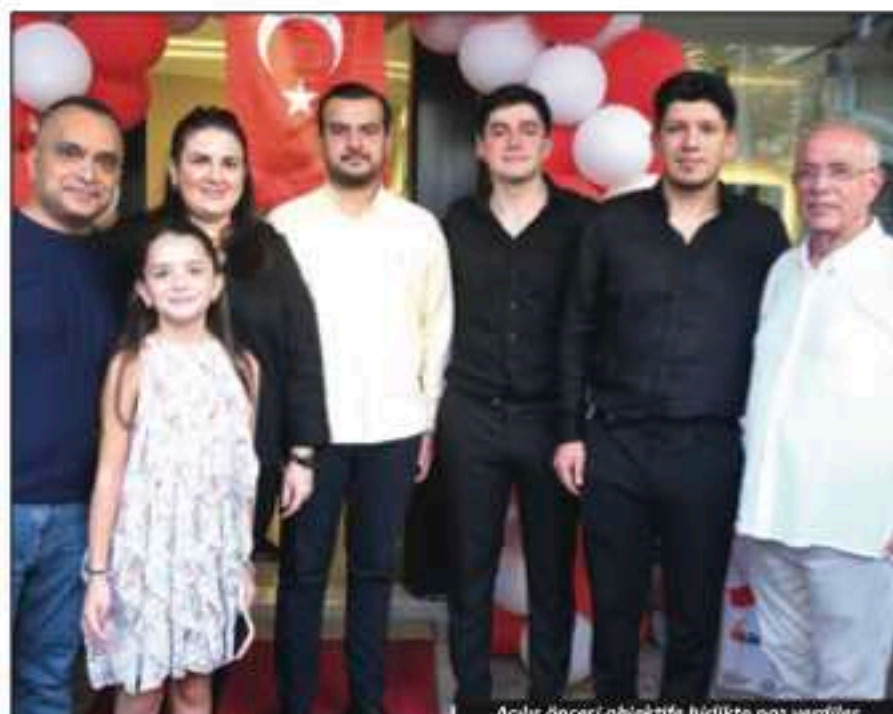
Açılış öncesi objektife birlikte poz verdiler.