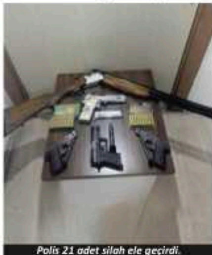
Polis 21 adet silah ele geçirdi.

Antalya'da Motosikletli Polis Timleri (Yunus), son bir haftada gerçekleştirdikleri çalışmalarda 56 aranan şahıs ve 29 uyuşturucu şüphelisi başta olmak üzere çok sayıda kişiyi yakaladı, silah ve uyuşturucu ele geçirdi.