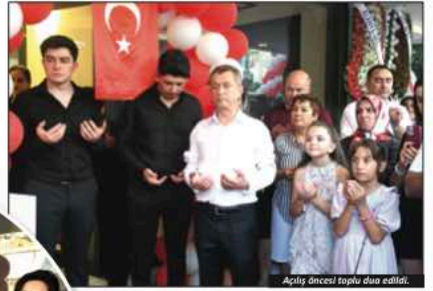
Açılış öncesi toplu dua edildi.