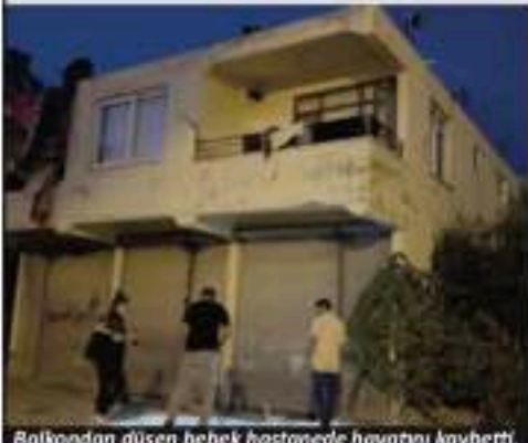
Balkondan düşen bebek hastanede hayatını kaybetti.