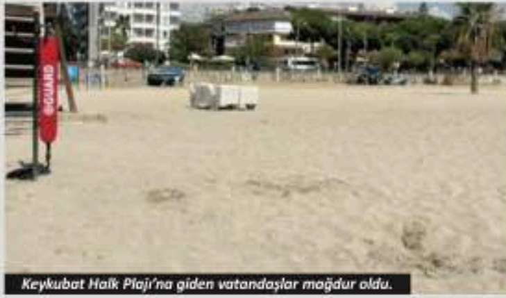
Keykubat Halk Plajı'na giden vatandaşlar mağdur oldu.