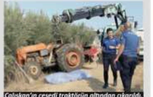
Çalışkan'ın cesedi traktörün altından çıkarıldı.