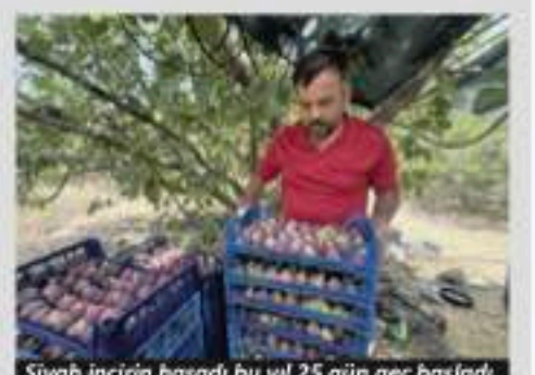
Siyah incirin hasadı bu yıl 25 gün geç başladı.