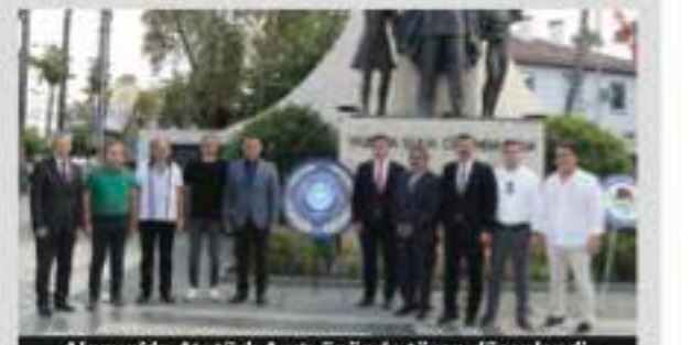
Alanya'da Atatürk Anıtı önünde tören düzenlendi.

Bunun için de iyi insan olmalarına vesile olacak bir yıl temenni ediyorum. Yine elbette sınavları da olacak. Sınav zamanları stresleri de olacak ama evde anneleri, babaları onların en büyük yardımcısı olacak. Hem ailelere hem öğretmenlere hem öğrencilere hem çocuklarımıza sınavların yanında en az bir spor branşıyla lisanslı olarak ilgilenmelerini, en az bir yabancı dili iyi konuşabilmelerini, bir müzik enstrümanını çalabilmelerini veya bir halk oyununu oynayabilmelerini tavsiye ediyorum. Çünkü insanları donanım sahibi yapan birey olarak bizim hayatla güçlü bağlar kurmamızı sağlayan, hayata özgüvenle bakmamızı sağlayan şey sadece okuldaki sınav başarılarımız değil. Bunun yanında edindiğimizi tecrübeler, donanımlar çok daha kıymetli" ifadelerini kullandı. Konuşmaların ardından şiirler okunup öğrenciler tarafından çeşitli gösteriler sunuldu. Daha sonra protokol üyeleri tarafından sembolik olarak ders zili çalındı. - Erkan Uysal