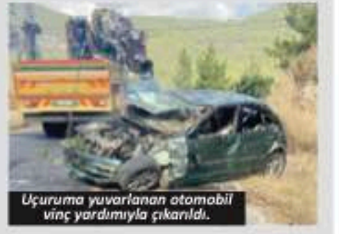
Uçuruma yuvarlanan otomobil vinç yardımıyla çıkarıldı.

ne olay yerine ambulans ve jandarma sevk edildi. Sağlık ekiplerince ilk müdahalesi olay yerinde yapılan yaralılar hastaneye kaldırıldı. Yaralılardan O.Y'nin sağlık durumunun ciddiyetini koruduğu öğrenildi. Olayın ardından şüpheli M.A. jandarma ekiplerince gözaltına alındı. - Yasemin Kaya